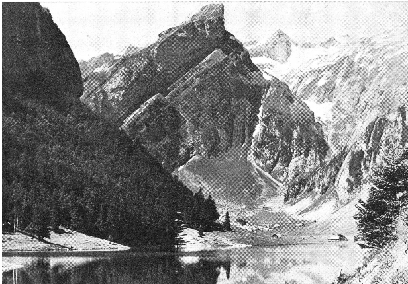
Der Seelalpsee mit der markanten Roßmad und dem Säntispifel

Die Frage, wann diese organisierten Genossenschaften entstanden sind, ist noch ungeklärt. Es ist aber wahrscheinlich, daß sie älter als ihre ersten urkundlichen Spuren sind. Auf jeden Fall wissen wir, daß