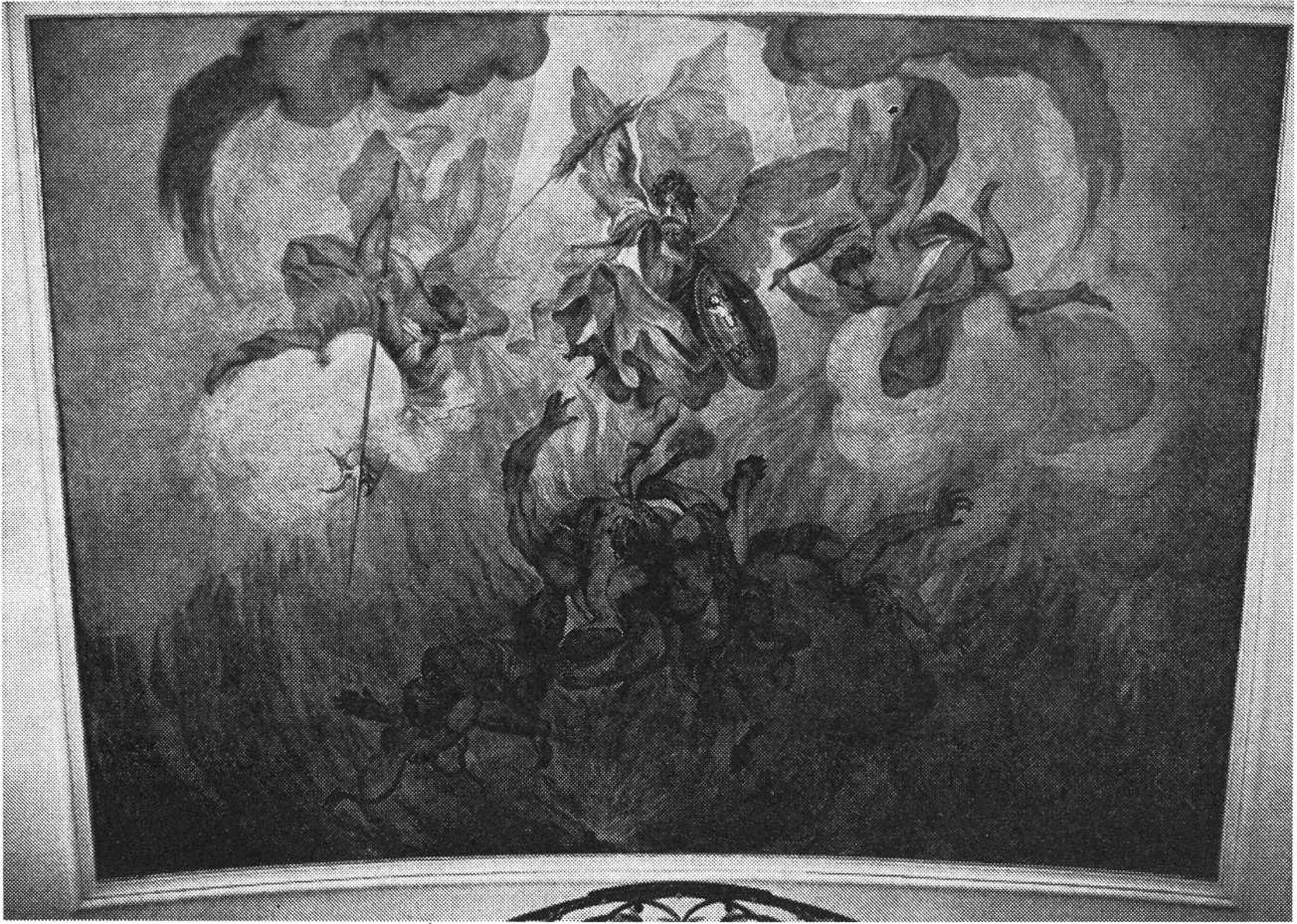
Unter dem süßlichen Engeltriumph kam auf der Originalschicht ein handfester Höllensturz der Verdammten zum Vorschein.

che auffallend, die Darstellung dessen, was folgt, wenn man nicht in den Himmel kommen kann oder ihn nicht erstrebt: ein aussagekräftiger Höllensturz. Gerade dieses letzte Bild war die Entdeckung während der Restauration, weil es von Deschwanden mit einem lieblicheren Hinweis auf das Jüngste Gericht übermalt war (während die andern Deckenbilder zum grössern Teil mit kräftigeren Farben nachgemalt waren).