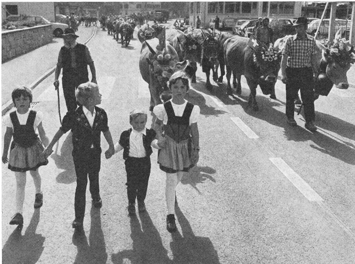
Alpabfahrt ab Triäbsee dur's Dorf Wolfeschiässe.

Die Bruderschaft beschränkt sich also von allem Anfang an nicht auf den kirchlichen Bezirk. Sie ordnete auch die weltlichen Festlichkeiten im Herbst für zwei Tage und in der Fastnacht am Gidelmon-