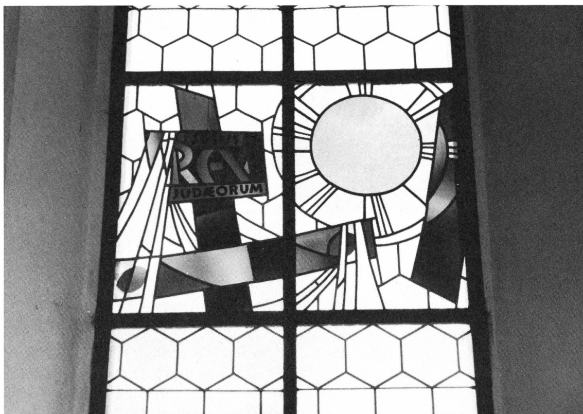
Die herrlichen Farbsymbole an den Fenstern schuf der Engelberger Künstler Pater Karl Stadler.