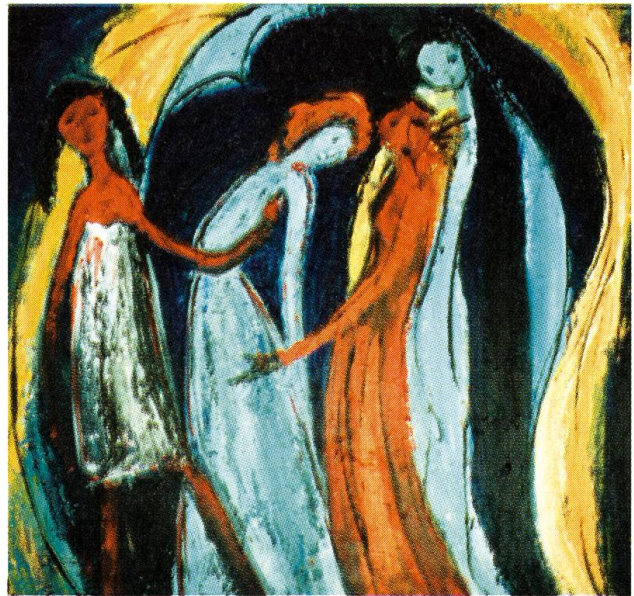
unten: Eleonore Amstutz