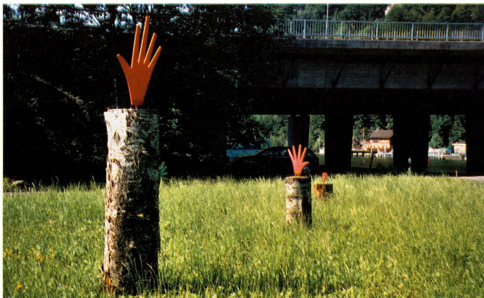
Von Lukas Gasser Holz mit roten Händen aus Kunststoff

Aber die Kulturkommission wäre nicht die Kulturkommission, wenn sie nicht auch an ihrem zehnjährigen Jubiläum ihrem Prinzip treu geblieben wäre, Kultur für alle zu bieten. Wer mit den ausgestellten Kunstwerken nichts anfangen konnte,