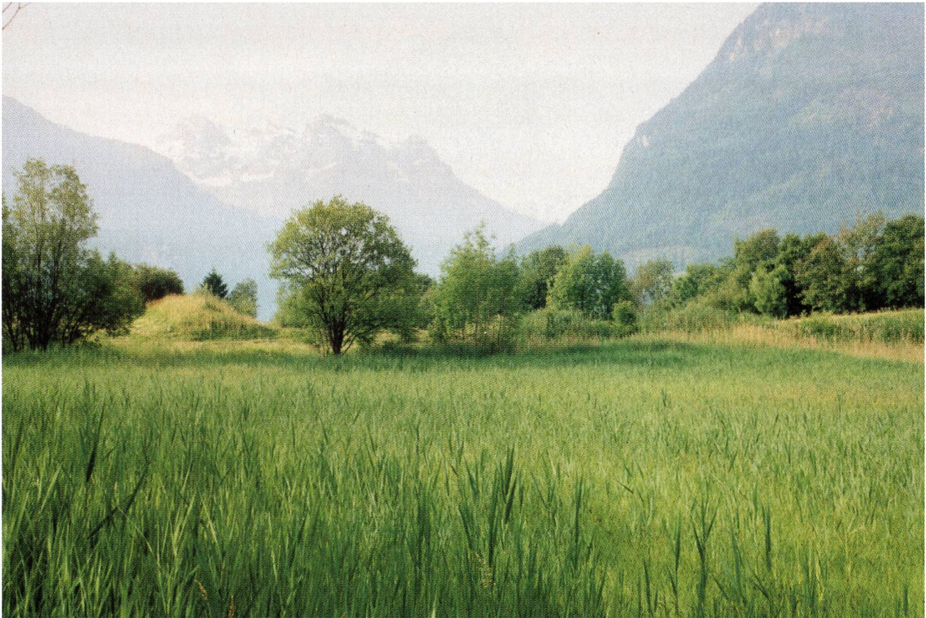
Das Gnappiried, eine Naturoase in der Stanserebene