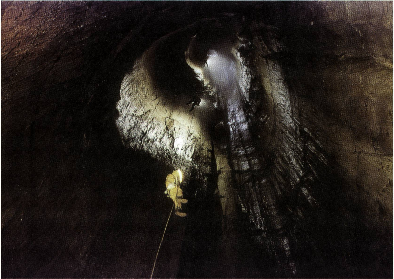
Höhlenschacht im Schrattenkalk der Moorlandschaft

reiche Gebüschgruppen aus Grün- und Grauerlen, Buschweiden, Bergföhren und Fichten auf. Die mit Pioniervegetation bedeckten Hangschuttfelder und tiefen Runsen sind für den landschaftlichen Aspekt ebenfalls wichtig. Der zentrale Teil besteht aus einem Wechselspiel von tiefen Bachtobeln und breiten Geländerücken. Er ist schwer zugänglich, wild und unberührt. Die Moore kommen in sehr hoher Dichte vor und liegen in kleinen und grossen Lichtungen auf den bewaldeten Eggen. Alte Pfade, welche in den Mooren als typische Steinplatten- und Prügelwege angelegt sind, durchqueren das Gebiet. Der Kessel, in dem sich die Moorlandschaft befindet, stellt eine aussergewöhnlich schöne, abgeschlossene Landschaftseinheit dar.