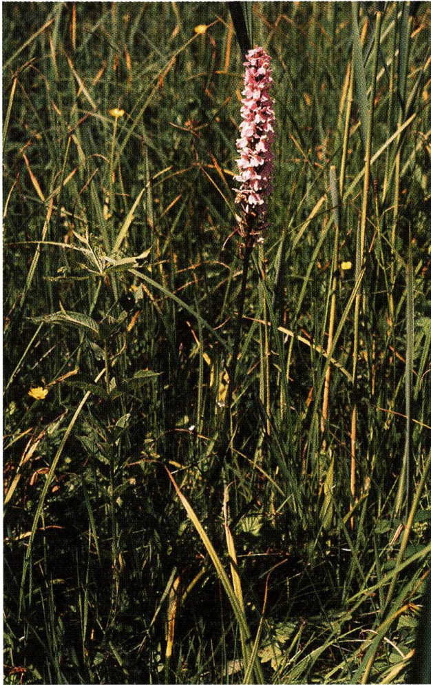
Seltene Orchidee im Riedgras

erneuerte der Kanton 1968 den alten Vertrag, wobei ein Teil der Vertragsfläche aus dem Naturschutzgebiet entlassen und zur Auffüllung frei