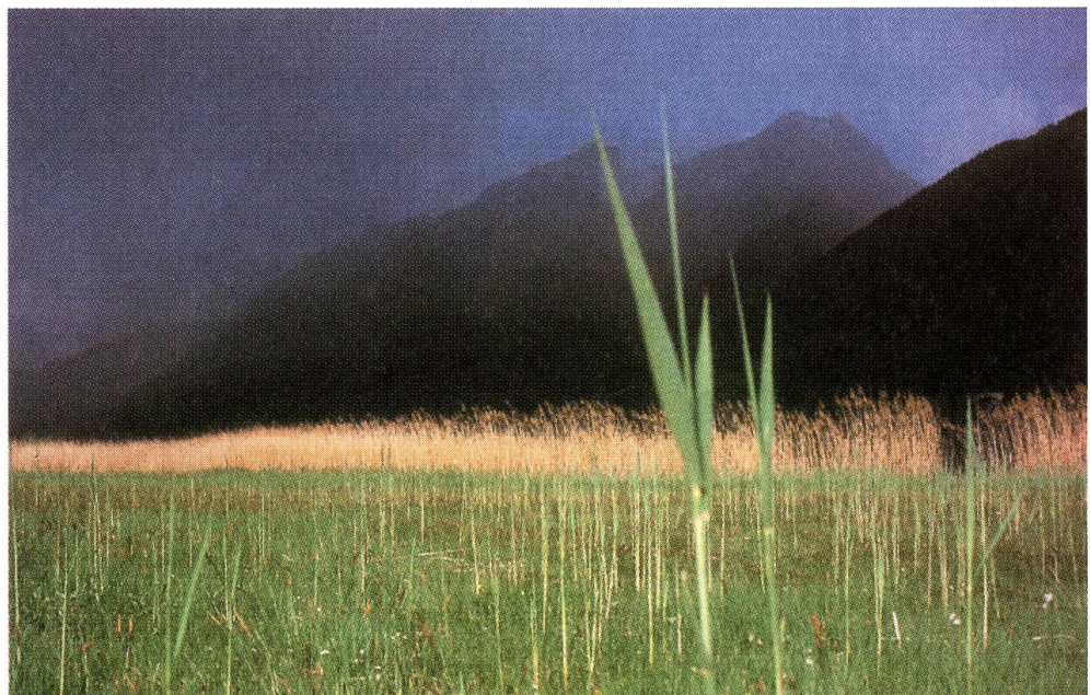
Gewitterstimmung über dem Stansstadterried

In den Jahren 1993/94 arbeitete Pro Natura in einer Sonderkommission zur Erarbeitung von Schutzbestimmungen und zur Vorbereitung der Unterschutzstellung mit. 1996 wurde die Verordnung vom Landrat genehmigt. Im gleichen Jahr wurde das Ried definitiv ins Inventar der Flachmoore von nationaler Bedeutung aufgenommen. Dank einer Spende konnte Pro Natura in den letz-