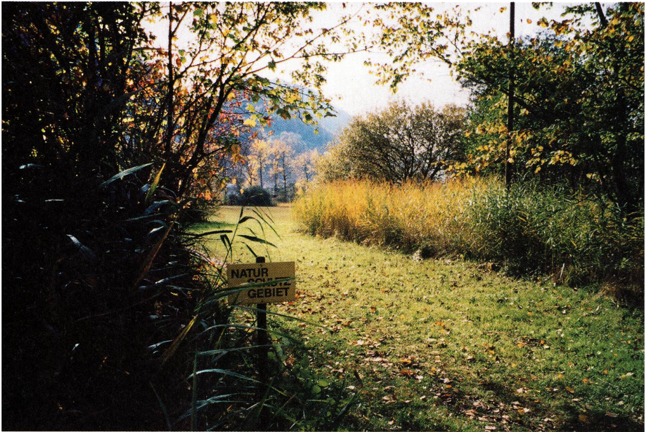
Im Störungen vom Naturschutzgebiet fern zuhalten...

hat Pro Natura im Stansstaderried einen Erlebnispfad geschaffen.