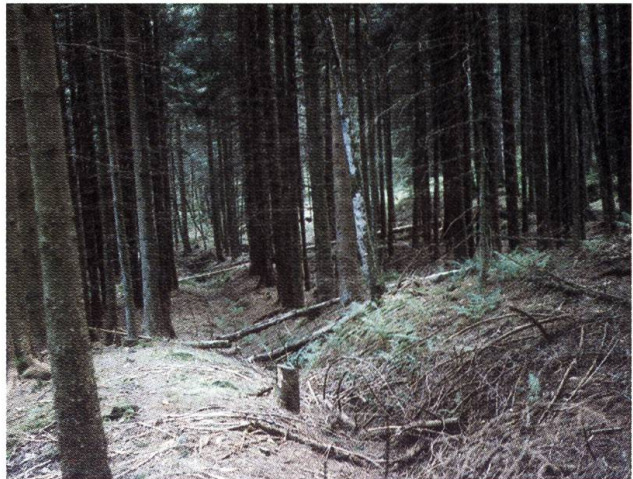
In den zwanziger Jahren wurden zahlreiche Gräben angelegt, um die Produktivität des Waldes zu verbessern.

Flächen, meist Flachmoore wurden aufgeforstet. In den Wäldern wurden Gräben angelegt, um den Boden zu entwässern und damit die Wälder wüchsiger zu machen. Diese Gräben, welche zum Teil tiefer als 1 m sind und nicht einmal 10 m voneinander entfernt liegen, sind noch heute zu sehen. Auch das Hochmoor Arven wird durch solche Gräben beeinträchtigt. Die Entwässerung eines Hochmoores führt zu einer Verheidung und somit zum Verschwinden der Hochmoorarten. Die Ablagerung und Verfestigung von Torf in einem Moor geht langsam vor sich. In den Voralpen wächst der Torfboden nur gerade maximal einen Millimeter im Jahr. Deshalb sind Beeinträchtigun-