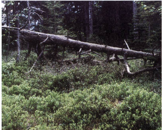
Die Rostblättrige Alpenrose besiedelt die trockeneren Flächen im Hochmoor-Bergföhrenwald bei Arven.

Um die zwanziger Jahre erlebte das Gebiet um die Fräkmüntalp starke Veränderungen. Offene