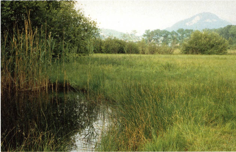
Verlandender Weiher – Lebensraum der Frösche und Ringelnattern

Der Bereich praktischer Naturschutz ist ein wesentlicher Teil für Pro Natura Unterwalden. Nebst Fördermassnahmen für Amphibienbestände, Heckenpflanzungen, Bachrenaturierungen, Wildstaudenverkauf etc. spielen die Naturschutzgebiete eine grosse Rolle. Nidwalden ist mit den verschiedenen Mooregebieten ein grosses Naturerbe anvertraut. Schliessen sie liebe Leserin, lieber Leser einen Augenblick die Augen und stellen sie sich eine Landschaft vor in der sie sich wohl fühlen. Ich wette darauf, dass eine Landschaft vor ihrem inneren Auge entsteht wie sie in verschiedenen Schutzgebieten von Nidwalden anzutreffen ist. Mooregebiete mit verschiedenen Hoch- und Flachmoorflächen sowie Auen in denen die Natur Vorrangfunktion hat. Solche Schutzgebiete sind aber weit mehr als Inseln für unsere Erholung. In intensiv genutzten Landschaften bieten sie bedrohten Arten dringend benötigten Lebensraum. In Nidwalden erfreuen wir uns an einigen, wenn auch nicht grossen Flächen, die uns den Blick freigeben für naturnahe und natürliche Zustände. Sie lassen uns ahnen, «was die Natur täte, wenn wir nichts täten» und bewahren uns davor zu vergessen, welches Naturerbe uns anvertraut ist. Pro Natura setzte sich für einige der bestehenden Gebiete ein. Wir möchten sie einladen, vier Gebiete ein bisschen näher kennen zu lernen. Vielleicht besuchen sie das eine oder andere. Sie werden begeistert sein, von der Vielfalt und Schönheit dieser Kleinode.