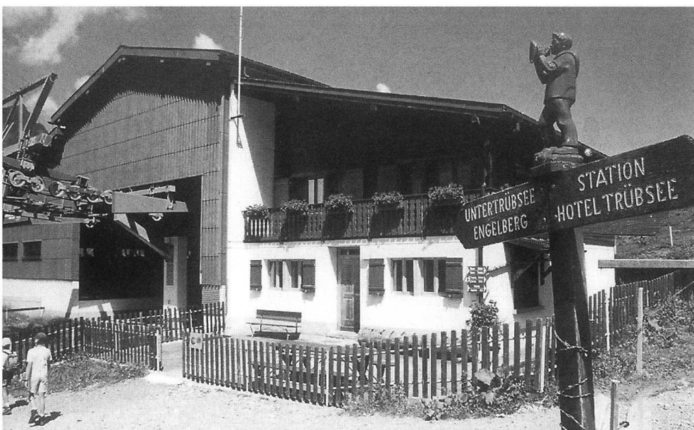
Richtung Hotel Trübsee

Der sachte Übergang vom ursprünglichen Kurbetrieb im Dorf Engelberg zum Wandersportort und Alpinismus führte dazu, dass da und dort damit begonnen wurde, für die fremden Gäste Milch und Molken auszuschenken. Sehr oft entwickelte sich in der Folge ein solcher Ausschank zum eigentlichen Gasthaus. Der einsetzende Tourismus brachte es mit sich, dass nicht nur im Tal selber, sondern auch in den Bergen immer mehr Gebäude zur Beherbergung von Gästen errichtet wurden. Die Initiative ergriff dabei der damalige Kur- und Verkehrsverein. Der Plan einer Clubhütte auf Rugghubel, der im November 1883 ins Auge gefasst worden war, sollte mit Hilfe des Schweizer Alpen-Clubs SAC durchgeführt werden. Anfangs Mai 1884 erteilte die Generalversammlung dem Kurvereinsvorstand die Vollmacht zur Ausführung des Projektes, das 1885 vollendet