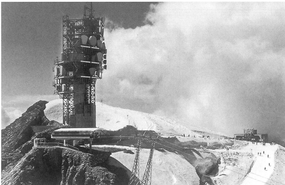
Fernmelde-Mehrzweckturm der Swisscom

Der Titlis hat schon seit jeher eine ganz besondere Ausstrahlung auf den zu seinen Füßen liegenden Talkessel von Engelberg und dessen Bevölkerung ausgeübt. Klar also, dass eines der ersten Hotels im Ort den Namen des Hausberges trug. Das Hotel Titlis – es war nicht irgend ein Hotel. Es war um die Jahrhundertwende das Hotel schlechthin. Albert Fleiner spricht in seinem Buch davon, dass «das Hotel und Kurhaus Titlis seinen Gästen jeglichen Komfort eines Hotels ersten Ranges bietet.» Seine Dimensionen waren für damalige Verhältnisse gigantisch. Das im