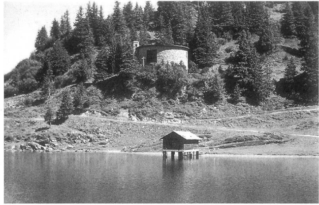
Kapelle auf Trübsee

Eine klassische SAC-Hütte, dessen Mauern mit grossen, aus der Gegend stammenden Steinen errichtet wurden, sucht man in der Nähe des Titlis vergebens. Die Rolle der Alphütten rund um den Trübsee übernahm das immer wieder erwei-terte Hotel Trübsee. Und inmitten all der touristi-schen Bauten steht auf Trübsee eine Oase der Ruhe – die 1935 zur Ehre Gottes, der lieben Mut-tergottes, des heiligen Antonius des Einsiedlers und des heiligen Bernhard von Menthone erbaute Kapelle. Grund und Boden im Ausmass von 714