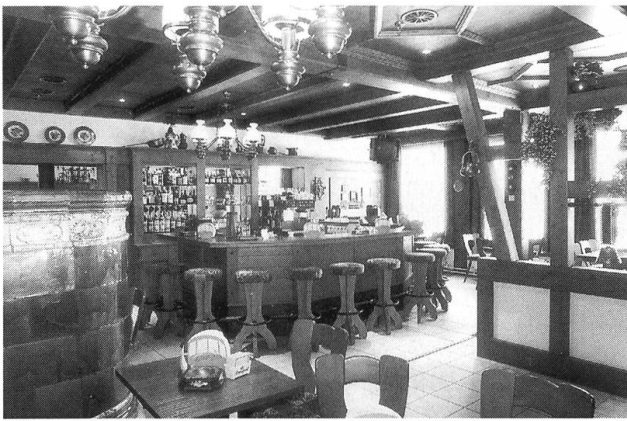
Ofen-Bar mit altem Ofen im Panorama-Restaurant auf dem Titlis.