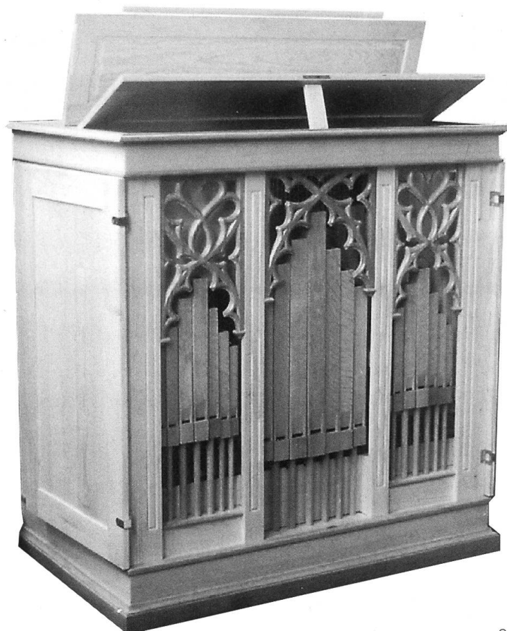
Orgel des Oberen Beinhauses Stans

an der Kanzelseite, über der Sakristei aufgestellt. Sie ist eine frühbarocke einmanualige, 8 Register zählende Chororgel mit beidseitigem Prospekt aus dem Jahre 1646, das einzige original nahezu komplett erhaltene Werk des berühmten Alpnacher Orgelmachers Niklaus Schönenbüel. Das edel singende Instrument des Obwaldners ist historisch, kann aber dennoch weiterhin auch in der gewandelten und im Wandel stehenden Liturgie sinnvoll eingesetzt werden. Die andere thront auf der oberen Empore an der Nordwand, die Hauptorgel, mit 3 Manualen und 43 Registern die grösste des Kantons. Ihre Anfänge lassen sich äusserlich am Gehäuse zumindest bis ins frühe 18. Jahrhundert nachweisen. Klanglich und technisch stammt das heutige prächtige Instrument