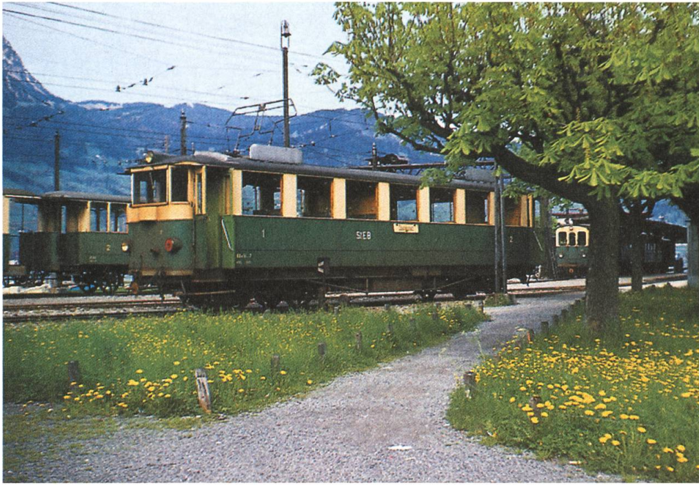
Ein Blick in den Bahnhof der Stansstad-Engelberg-Bahn bei der Schiffflände in Stansstad, wo das einstige Stationsgebäude immer noch vorhanden ist