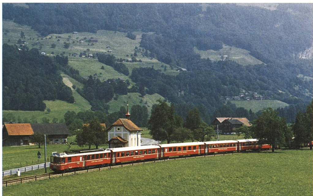
Ein Pendelzug der Luzern-Stans-Engelbergbahn in voller Fahrt vor der Rochuskapelle in Oberdorf

porte, auf denen die Bahnwagen von der Normalspurbahn auf Schemmel geladen und auf den Schmalspurgleisen nach Nidwalden und Obwalden gebracht wurden. Ab den grösseren Bahnhöfen gab es Camioneure, welche die Güter in den Dörfern verteilten. Inzwischen hat der Güterverkehr auf den Schienen durch die Strasse Konkurrenz erhalten. Heizöl oder Flugpetrol für die Bundesbetriebe kommen heute auf der Strasse und selbst die Post hat der Bahn ihre Liebe gekündigt. Das beste Beispiel für den kleiner werdenden Bahngüterverkehr liefert die Tatsache, dass die Tage des Stanser Güterschuppens