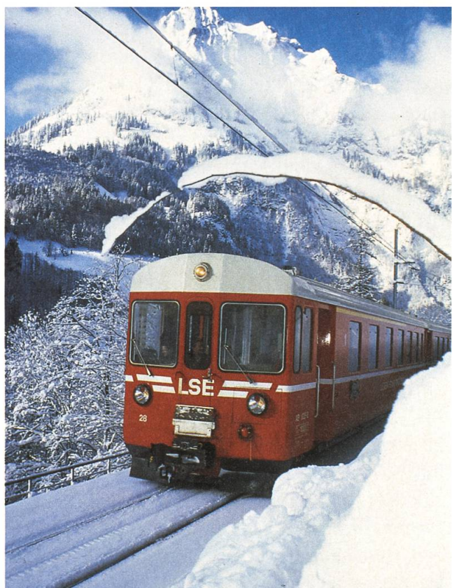
Die Bahn ist ein wichtiger Zubringer für den Wintersportort in Engelberg

gezählt sind, welcher bei der Anpassung des Bahnhofs Stans an die heutigen Erfordernisse abgebrochen wird. Die Touristen sind der Bahn treu geblieben und es kommen dank guten Fahrpreisen und Billettkombinationen immer mehr. Was in den vergangenen dreissig Jahren besonders gewachsen ist, sind die Pendler-Passagiere. Die ersten Bahnhöfe wurden im 19. Jahrhundert am Rand der Städte gebaut. Verständlich, denn die gewachsenen Städte schirmten sich damals mit einer Stadtmauer ab. Die Städte sind gewachsen und die Bahnhöfe sind heute im Zentrum. Das Bahnhofareal selber wird heute als Dienstleistungszentrum besser genutzt. Dazu kommt, dass die Strassen in den Städten an chronischer «Verstopfung» leiden. Deshalb ist die Bahn heute das Transportmittel, das die Pendler am schnellsten zum Arbeitsplatz und wieder nach Hause bringt. Im Gegensatz zum motorisierten Verkehr, der von den Planern immer mehr neue Strassen verlangt, verkehrt die Bahn noch heute auf den Trassen, die vor rund hundert Jahren gebaut wurden. Dank moderner Technik beim Rollmaterial kann die Bahn ihre Leistungen steigern, ohne immer neue Trasselinien zu bauen.