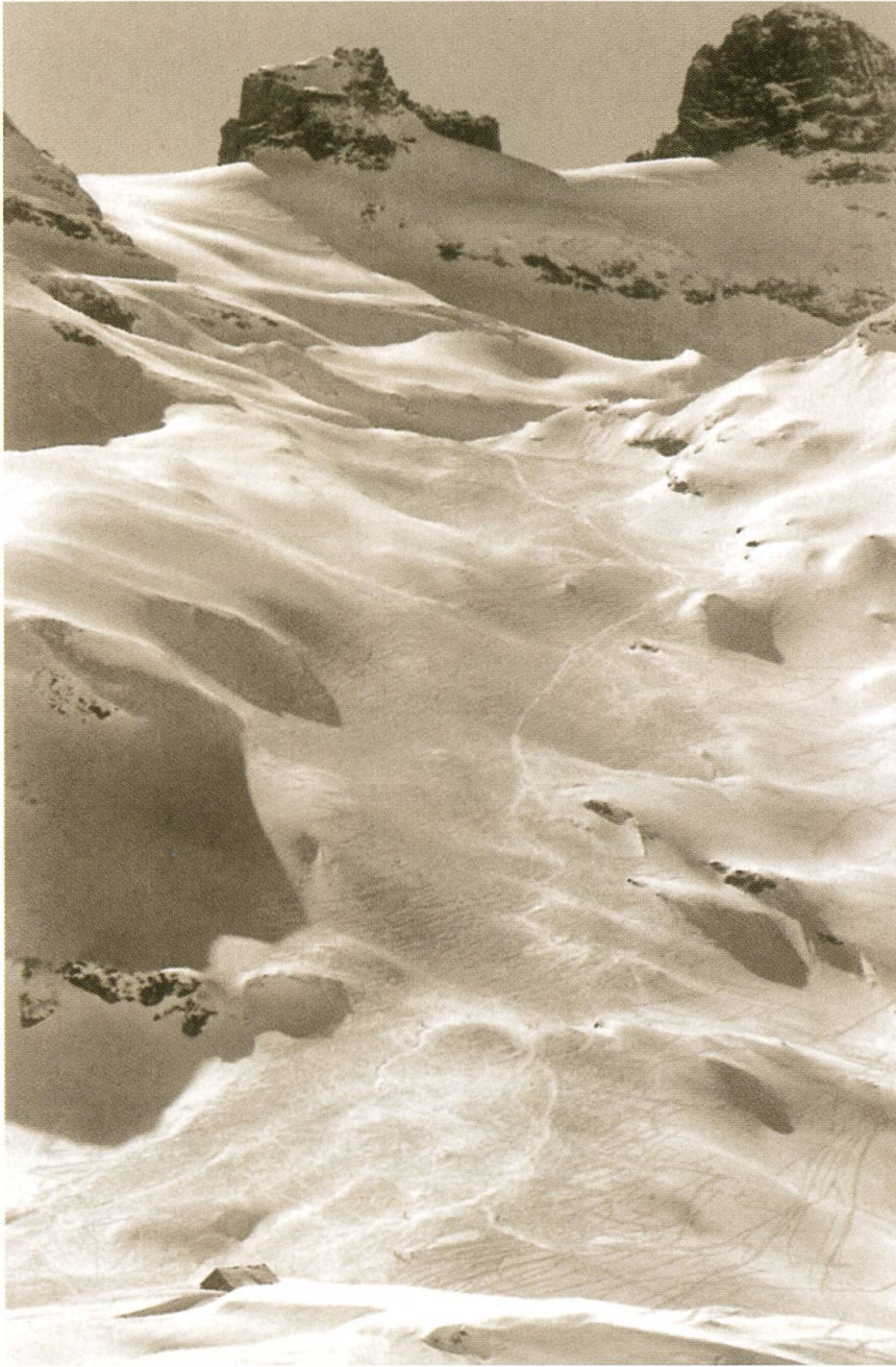
Jochpassabfahrt noch ohne Skilift.