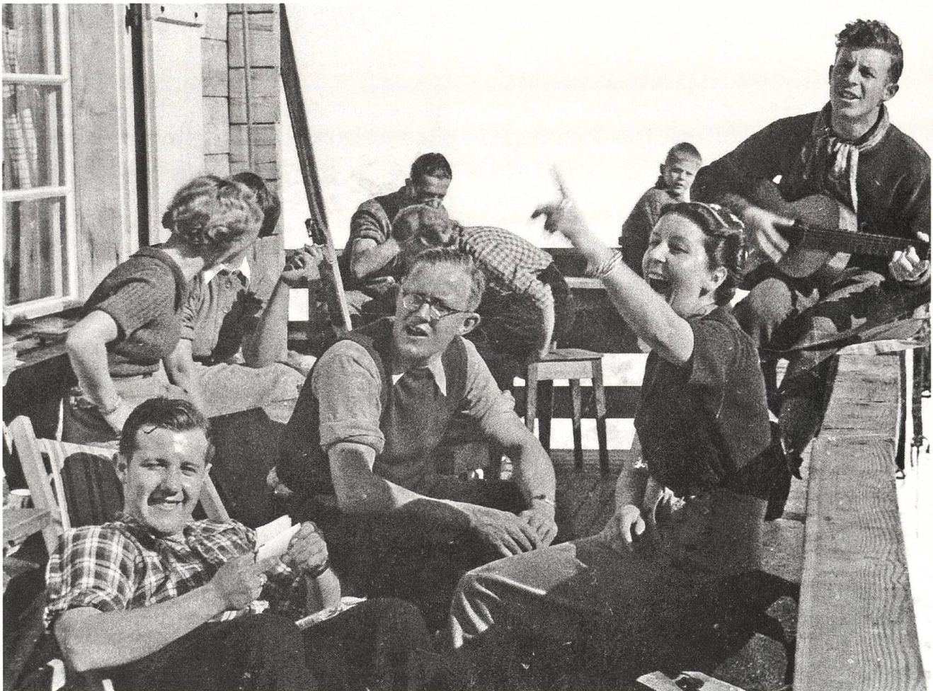
Die Jeunesse dorée de Stans.

Eine Fünfsternbleibe ist die Jochhütte nicht, eher so eine Art Romantikhôtel, wo das Übernachten inklusive Romantik aber nur grad sieben Franken kostet. Für die sieben Franken gibt es ausser der Romantik noch jede Menge Natur pur und eine Stille, die nachts nur vom Polen der Steine gestört wird. Auch tagsüber ist es kaum lauter, nur die Murmoltern pfeifen, die Gemsen trehlen Steine, und ab und an hört man einen fröhlichen Berggänger juizen. Ringsum blüht es in den schönsten Farben, die Bränderli duften nach Vanille, und an der stotzigen Seite vom Ochsenhorn stehen die Edelweiss fast so üppig wie im Stanserboden die Siibluemen. Zwischen Blumen und Steinen sonnt sich ab und zu eine Viper. Mit Vipern hat der Naazi gar nichts am Hut, und wenn er nur eine ahnt, rennt er davon und macht vor Angst Sprünge wie