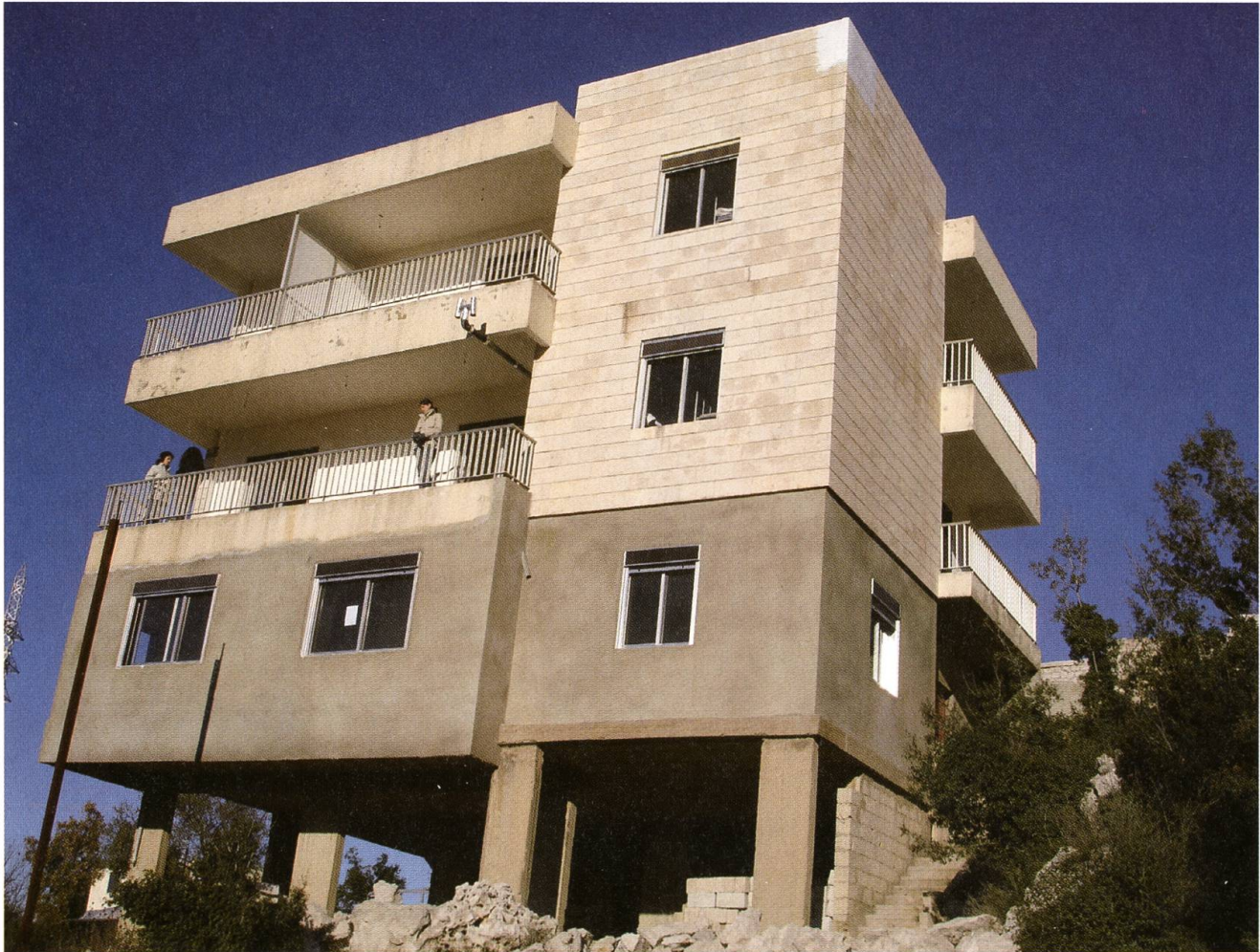
Das Haus des Friedens in Achkout, einigermassen renoviert.

Dank der grosszügigen Spende der Firma Victorinox in Ibach SZ konnte nahe beim Städtchen Achkout, auf einem Hügelzug 35 Kilometer nördlich von Beirut mitten in einer eindrücklichen Naturlandschaft auf 1000 Metern Höhe ein Gebäude erworben und hergerichtet werden. Ursprünglich als Luxusresidenz einer reichen Familie entworfen, die es aber nie bezog, stand das Gebäude noch Anfang 2006 etwas heruntergekommen und ziemlich einsam in der Landschaft. Das umliegende Gelände ebenso wie der Boden, auf dem es sich befindet, gehört einer Beiruter Pfarrei und wurde seit Jahren für Ferienkolonien genutzt, mit Zelten und einer notdürftig eingerichteten Küche.