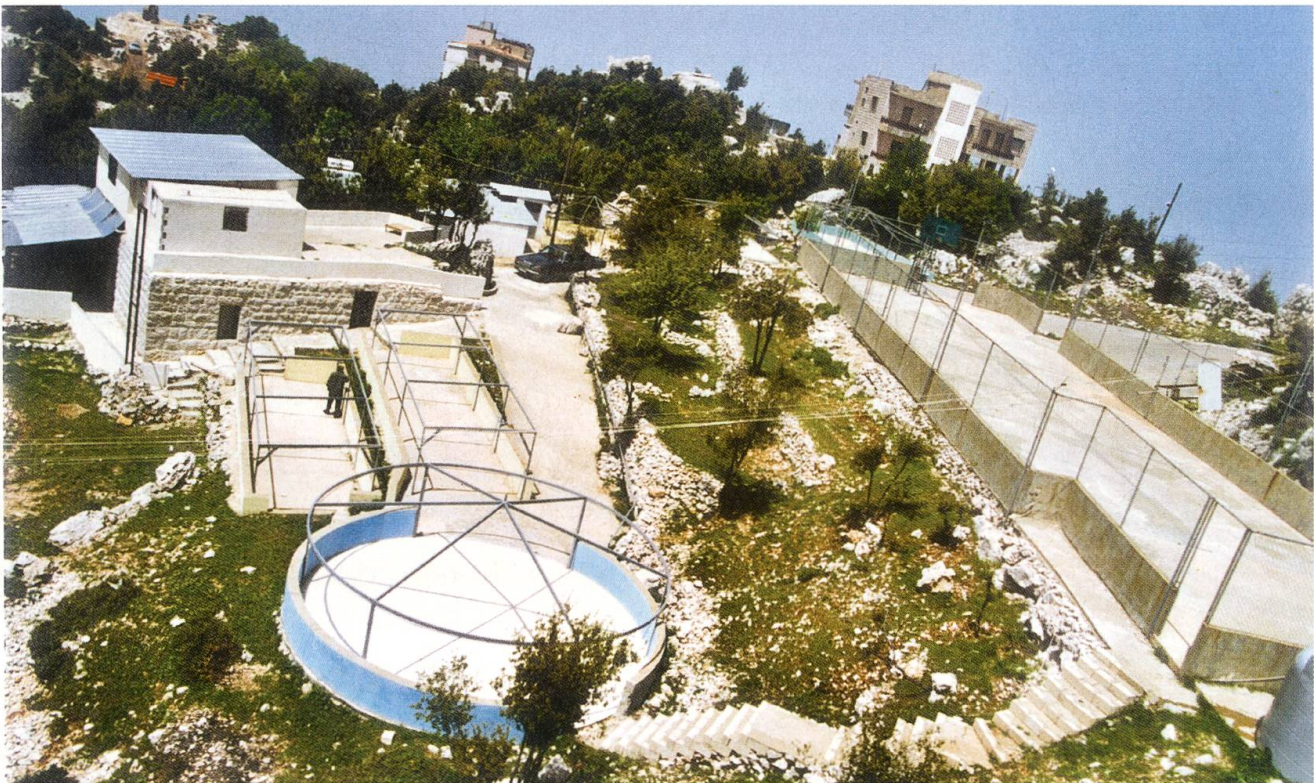
Das 5'000 Quadratmeter grosse Areal vor dem Haus des Friedens. Hier soll ein «Garten des Friedens» entstehen.