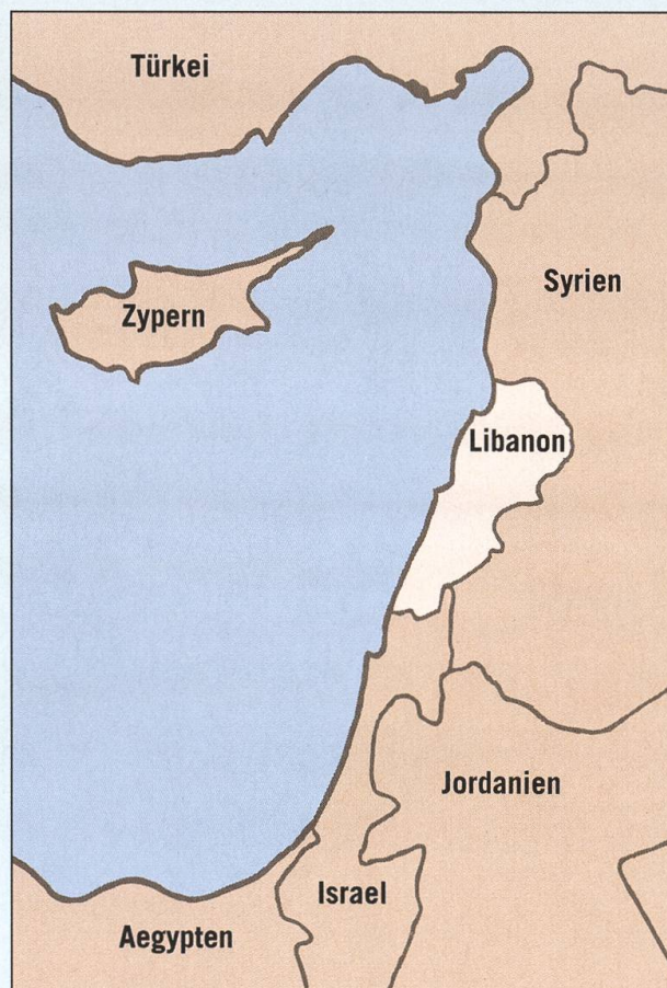
Libanon ist rund ein Viertel so gross wie die Schweiz.

Im Gegensatz zu den verschiedenen Gruppen der palästinensischen Widerstandsbewegungen rekrutierte sich die Hisbollah aus gebürtigen Libanesen. Die Hisbollah beteiligte sich deshalb als Organisation nie an bewaffneten Aktionen gegen libanesischen Bürger. Sie galt als nicht korrupt und richtete in ihren Einflusszonen all jene sozialen Dienste ein, die im Staat fehlten. Sie führte den Kleinkrieg gegen die israelische Besatzungsarmee im Süden so wirksam, dass Israel sich im Jahr 2000 überstürzt zurückzog,