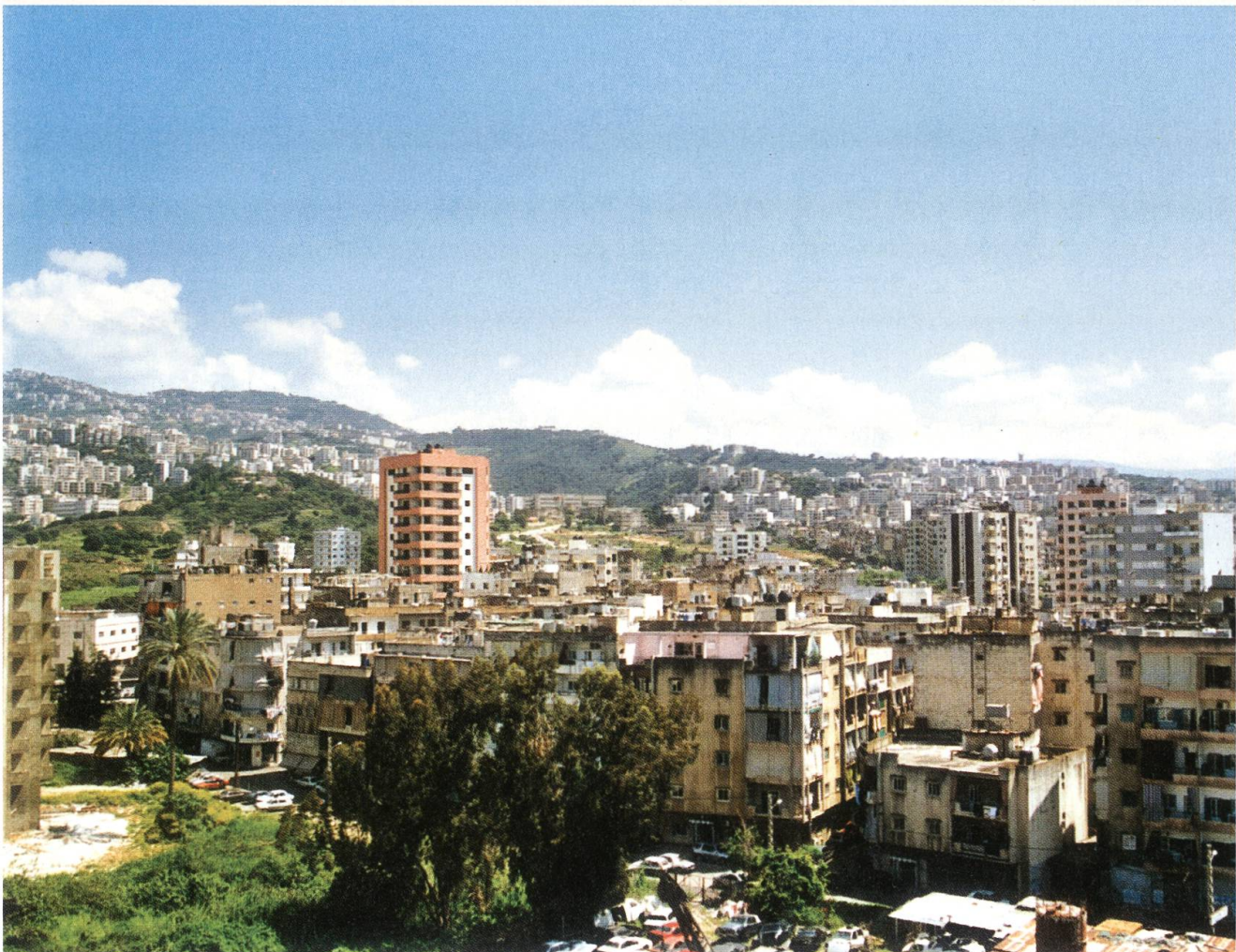
Das Quartier Bauchrieh in Beiruth, wo die Pfarrei St. Jean Baptiste ist.

«Wir leben in einem Zustand chronischer Überarbeitung, unter extremem Stress», erzählt eine andere Lehrerin, die ebenfalls anonym bleiben will. «Es wird von Jahr zu Jahr schlimmer, aber für die meisten Libanesen ist dieser Zustand normal geworden. Ich kenne weit und breit niemanden, der heute noch mit Freude zur Arbeit gehen könnte.» Der Schultag ist für alle erschöpfend. Er beginnt meistens um 7.15 Uhr und endet um 14 Uhr. Für