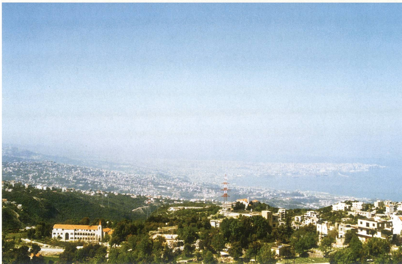
Ausblick von Achkouf auf die Millionenstadt Beirut.

Für alle, die in den Pfarreischulen von Antélias lehren und lernen, ist es ein überwältigendes Erlebnis, wenn sie von Zeit zu Zeit aus den bedrückenden Quartieren ausbrechen und sich an einem friedlichen, naturnahen Ort erholen können. Solche «Ferien» sind wichtige Pausen von den Kriegswirren. Auch das ist dem Verein Solidarität Libanon-Schweiz ein grosses Anliegen.