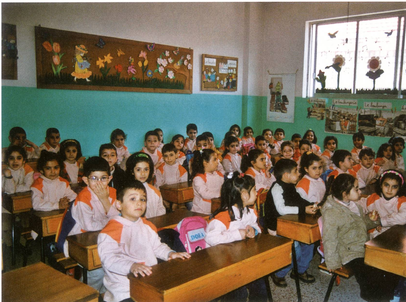
Kein Platz, kaum Ausrüstung: Schulzimmer der Pfarreischule in Bauchrieh.

Es liessen sich noch viele Punkte anfügen... Das Fazit lautet: Es ist unmöglich, alles auf einen Nenner zu bringen. Was es braucht, ist einerseits eine