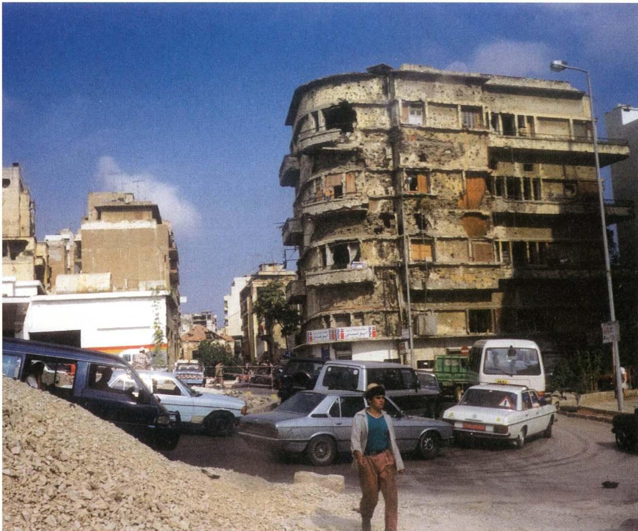
Die Verwüstungen durch die Kriege klaffen immer noch wie Wunden im Stadtbild: Beirut im Sommer 2006.

Humanitäre Hilfe ist kein Sonntagsgeschäft. Sie ist dort notwendig, wo Länder von chronischem Unheil heimgesucht werden, und in der überwiegenden Zahl der Fälle trifft man die gleichen Strukturen: Die Gesellschaft zerfällt in Clans, die sich um Führungsgestalten sammeln und miteinander in feindlicher Konkurrenz um knappe Ressourcen leben. Klientelismus (die Erfindung der alten Römer: «Klienten» sammeln sich um Politiker und sichern ihnen die Macht, während diese ihnen materielle Hilfe und Schutz garantieren) ist fast