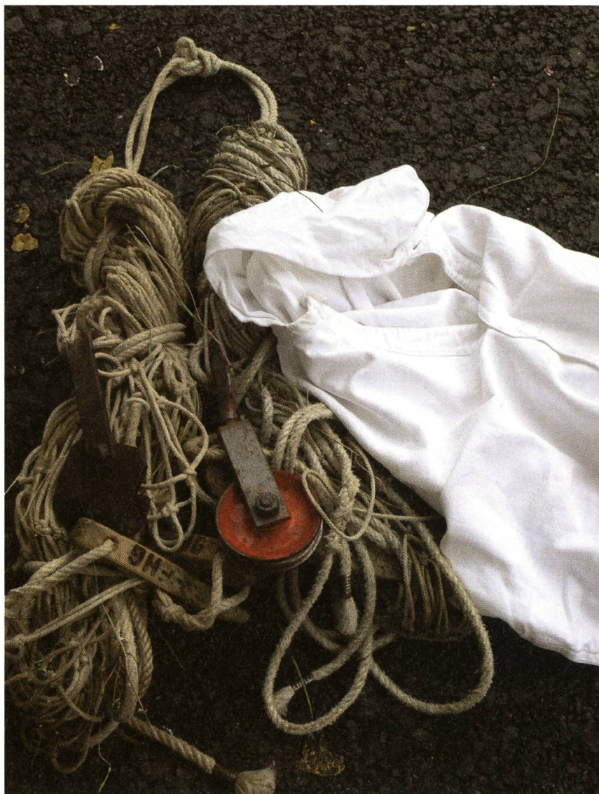
Ausrüstung fürs Planggenheuen.

Wie viele Heubündel er auf der familieneigenen Liegenschaft Bielen schon auf seinem Rücken zum Stall oder einem der Heuseile getragen hat, weiss er nicht. «Gezählt habe ich sie nie. Mit dem Alter aber macht sich im Bereich des Rückens das eine oder andere Ziehen bemerkbar.» Er habe sich gerade in jungen Jahren nicht immer geschont, meint er mit einem Achselzucken.