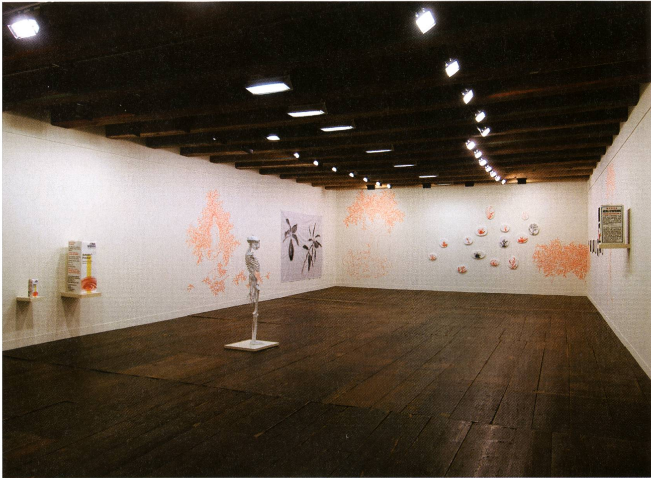
Donato Amstutz und Bea Emsbach ergänzen einander harmonisch.