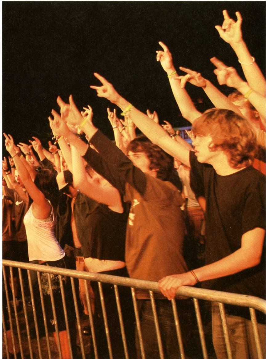
Der Nidwaldner Festivalsommer 2007 bot viel für die Fans.

Acht Kunstschaffende wurden eingeladen, ein Projekt für eine künstlerische Intervention einzureichen. Eine Jury unter dem Vorsitz von Herbert Gnos – zusammengesetzt aus Künstlern, dem Architekten und den Vertretern der Betreiber – sichtet die Projekte. Sämtliche eingereichten Vorschläge gingen auf die Funktion des Gebäudes ein. So wurde das Gebäude bei einem Vorschlag durch einen Wassergraben zur Burg. Ein