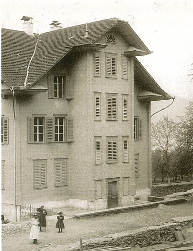
Buochs, Schulhaus, erbaut 1851, abgebrochen 2006.

übernahmen die Schwestern die nahe gelegene Mädchenschule. Zuvor schon, 1601, hatten ihnen die Kirchgenossen ein kleines Häuslein und das Pfrundhaus der «Amsteinpfründe» oberhalb des Rathausplatzes überlassen, da sie sich durch das Halten einer Mädchenschule nützlich gemacht hatten. Zur Klostergründung kam es jedoch erst 1618 und zum Bau eines Frauenklosters 1620 bis 1625. Die Führung einer Mädchenschule war die wesentlichste Aufgabe des Klosters. Nachdem die Oberleitung über das Kloster vom Abt von Muri an die Kapuziner übergegangen war, wurde 1674 eine strenge Klausur eingeführt. Die nachreformatorische Blütezeit ermöglichte 1728 bis 1730 eine Vergrösserung des Klosters um den dorfabwärts gerichteten, parallel zum St. Klara-Rain verlaufenden Annexbau. 1798 wurde in diesem Annexbau eine Waisenanstalt für Mädchen und Knaben eingerichtet, der Pestalozzi vorstand. 1799 wurde die Anstalt aufgehoben und den französischen Truppen als Unterkunft zur Verfügung gestellt – dieser Bau wird heut fremdgenutzt. Erst 1867 wurde den Schwestern die Bewilligung zur Gründung eines Internats und 1889 eines Lehrerinnenseminars (1889–1953) erteilt. 1970 zogen sich die Schwestern aus der Dorfschule zurück.