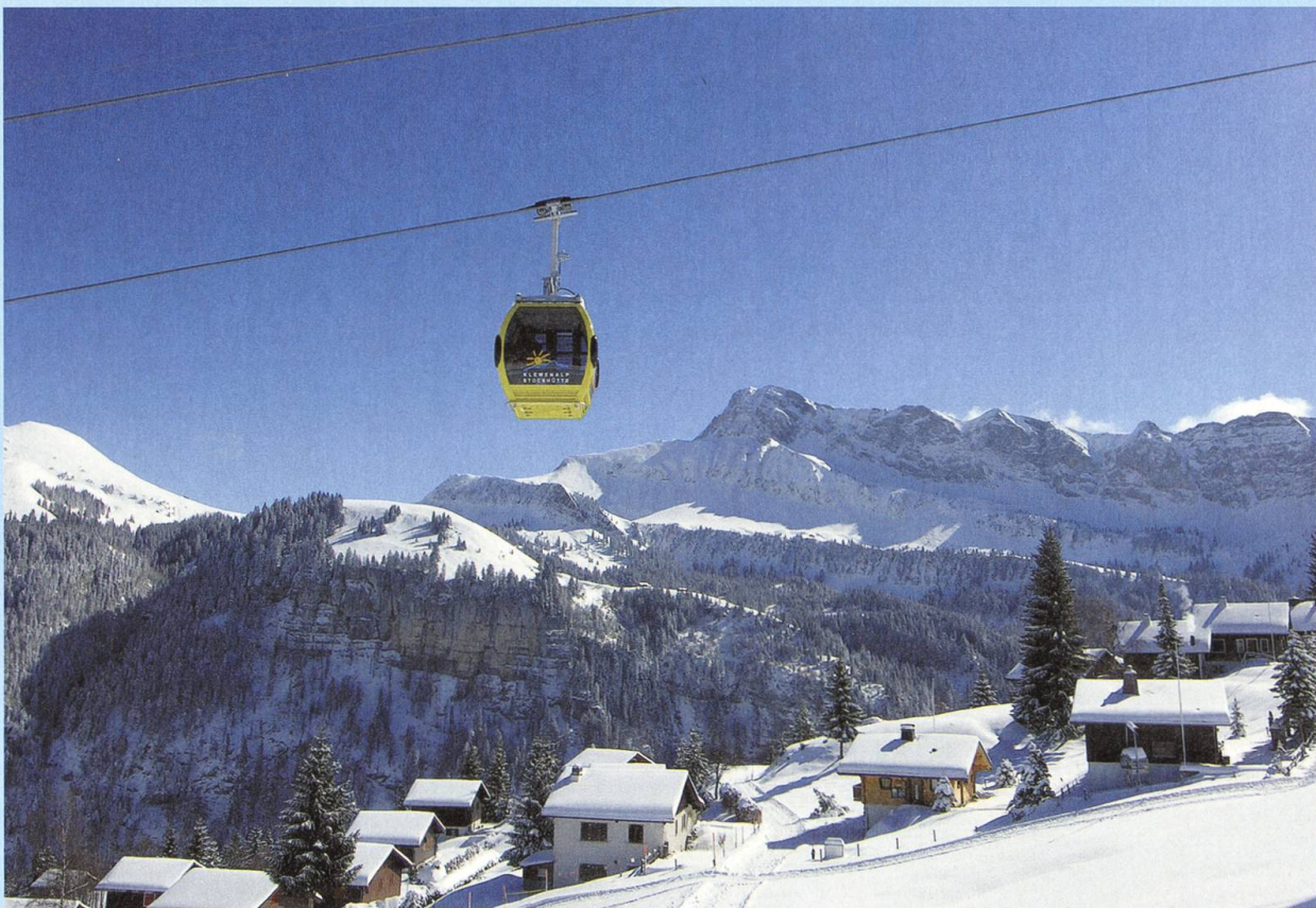
In den neuen 6er-Gondeln in 6 Minuten hinauf zur Stockhütte.

90er-Jahre die Betriebsbewilligung ausgelaufen war, wollte man eine neue Sesselbahn vom Choltal auf die Twäregg bauen. Das Projekt scheiterte – was auch die Verbindung zum Skigebiet Klewenalp massiv verschlechterte. Seit im Sommer 2004 der Skilift «Twäregg» verlängert wurde, ist dieses Problem behoben. Vor einem Jahr nahm die neu erstellte 6er-Gondelbahn mit kuppelbaren Klemmen den Betrieb auf. Sie überwindet eine Höhendifferenz von 533 Metern, benötigt dafür sechs Minuten und befördert stündlich 600 Personen. Sie ist nicht nur für die BBE AG, sondern auch für Emmetten wirtschaftlich und touristisch wichtig.