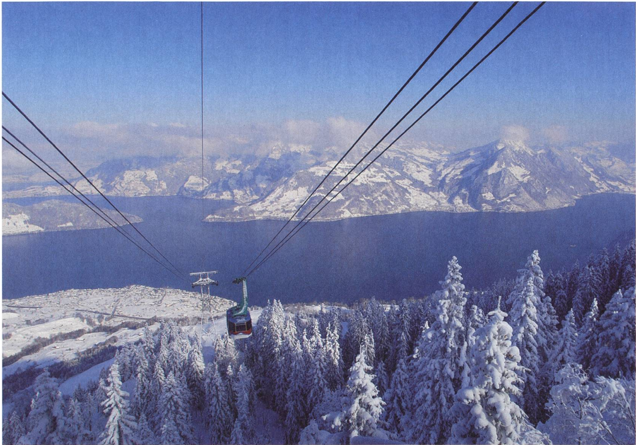
Die Klewenalp im Winter: Ein Paradies für kleine und grosse Schneesportbegeisterte.

Die Schweiz hat 124 Pendelbahnen, 214 Gondelbahnen, 59 Standseilbahnen, 3143 Sessellifte und 1072 Skilifte*. Da kann ja die Klewenbahn wohl nichts Besonderes sein. Falsch geraten! Für Beckenried ist das «Klewenbähnli» etwas Einzigartiges. Es gehört zum Ortsbild wie See und Berge, Kirche und Autofähre. «Eyses Bähnli» sagen die Einheimischen liebevoll – und besitzergreifend. Die Klewenbahn erleichtert ihnen Schul- und Arbeitsweg, sie bringt im Sommer die Älpler auf den Berg und die Milch ins Tal. Und im Winter bietet das Unternehmen willkommene Nebenerwerbsmöglichkeiten: Landwirte und Bäuerinnen bedienen die Skilifte, grillieren Würste, kochen Suppe, servieren an der Schneebar oder fahren mit dem Pistenbully. Mit mehr als 80 Mitarbeitenden ist die Klewenbahn dann einer der grössten Arbeitgeber im Ort. Die Einheimischen verbinden mit der Klewenbahn aber auch Freizeit, Hobby und Erholung. «Eyses Bähnli» transportiert sie an die Sonne, wenn das Dorf im Nebel versinkt, es ist Ausgangspunkt für