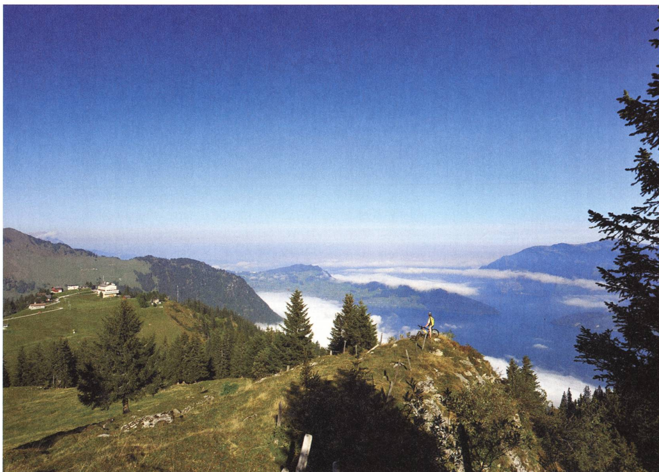
Die Klewenalp im Sommer: Ein Paradies für Wanderer, Familien, Biker, Kletterer, Gleitschirmflieger.

Die Erstellungskosten von 285'000 Franken sollten durch Genossenschaftskapital einerseits und Anteilscheine im Wert von je 100 Franken andererseits beglichen werden. Der Weg war zäh, Auswärtige mussten der Genossenschaft unter die Arme greifen. Doch dann war das Geld beisammen, die Firma Robert Aebi & Cie AG Zürich begann mit dem Bau – und am Karsamstag, den 15. April 1933, konnte die neue Bahn offiziell den Betrieb aufnehmen. Das Aussergewöhnliche an der neuen Anlage waren die Länge von mehr als drei Kilometern, aber auch