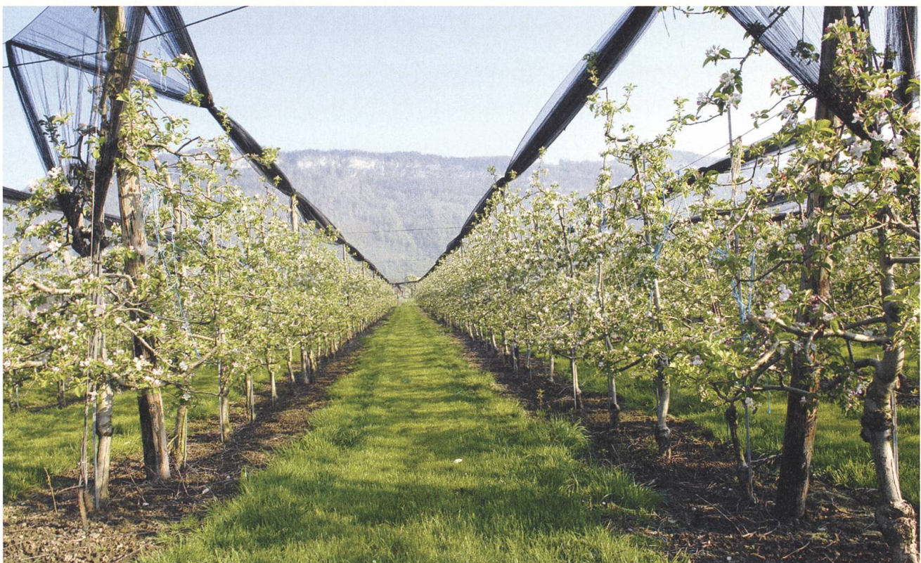
Niederstamm-Kulturen sind kein Gewinn für das Landschaftsbild, aber ertragreich...