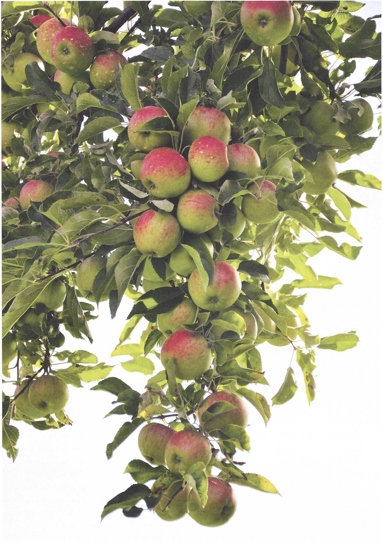
Was für eine Pracht: Eine üppige Apfelernte steht bevor.