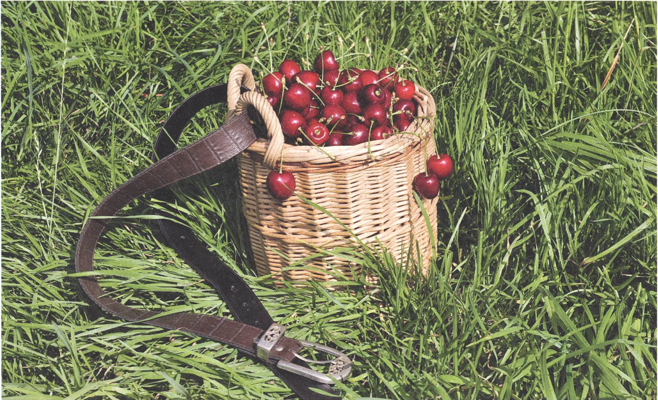
Schweizweit werden auf 444 Hektaren Land Kirschen angebaut.

2008 die Neu- beziehungsweise Ersatzpflanzung von Hochstamm-Feldobstbäumen. Das Angebot wurde denn auch rege benutzt: Der Rahmenkredit von 180'000 Franken für die Jahre 2008 bis 2011 wurde mit der Anpflanzung von 1400 Hochstammbäumen um 100 Prozent überschritten. Der Kanton konnte nicht alle neu gepflanzten Hochstämme unterstützen.