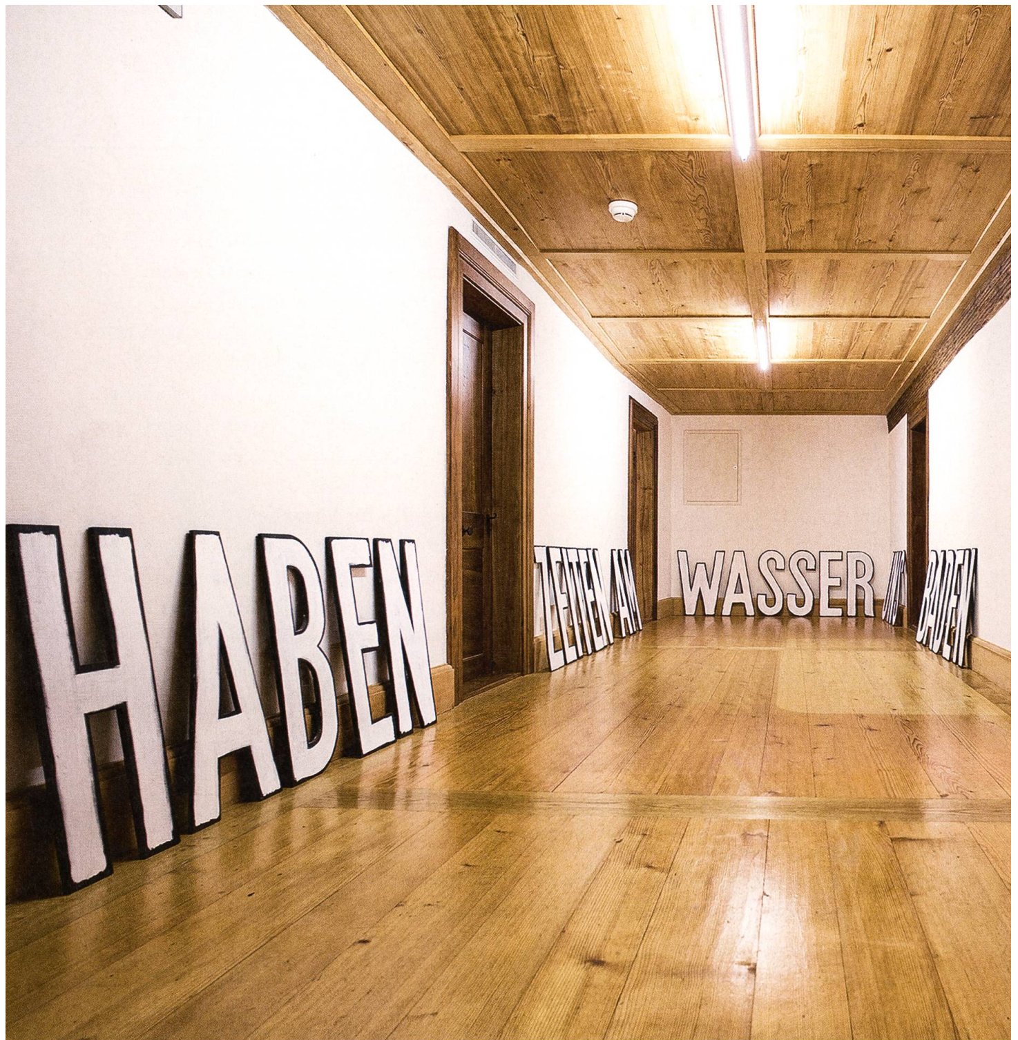
«Nachhall und Witterung», Arbeit von Heini Gut. Winkelriedhaus, Stans, Sammlungspräsentation.

Mehrspartenmuseum, also ein Haus, in dem verschiedene Themen aufgearbeitet werden. Diese Themen werden aber klar auseinandergelassen. Im Musée d'art et d'histoire in Genf zum Beispiel wird im einen Stockwerk nur Kunst gezeigt, in einem anderen Archäologie, in je einer weiteren Etage werden Kunsthandwerk und Geschichte präsentiert. Im Nidwaldner Museum haben wir die Themen den Häusern zugeordnet. Das ermöglicht uns mehr Flexibilität in den einzelnen Häu-