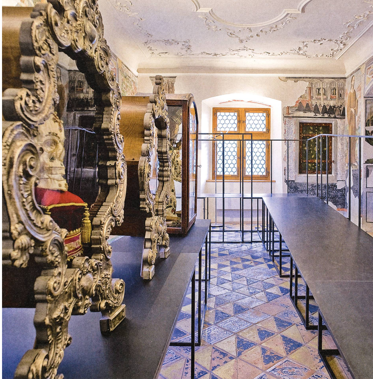
«Nachhall und Witterung», Klosterarbeiten. Winkelriedhaus, Stans, Sammlungspräsentation.