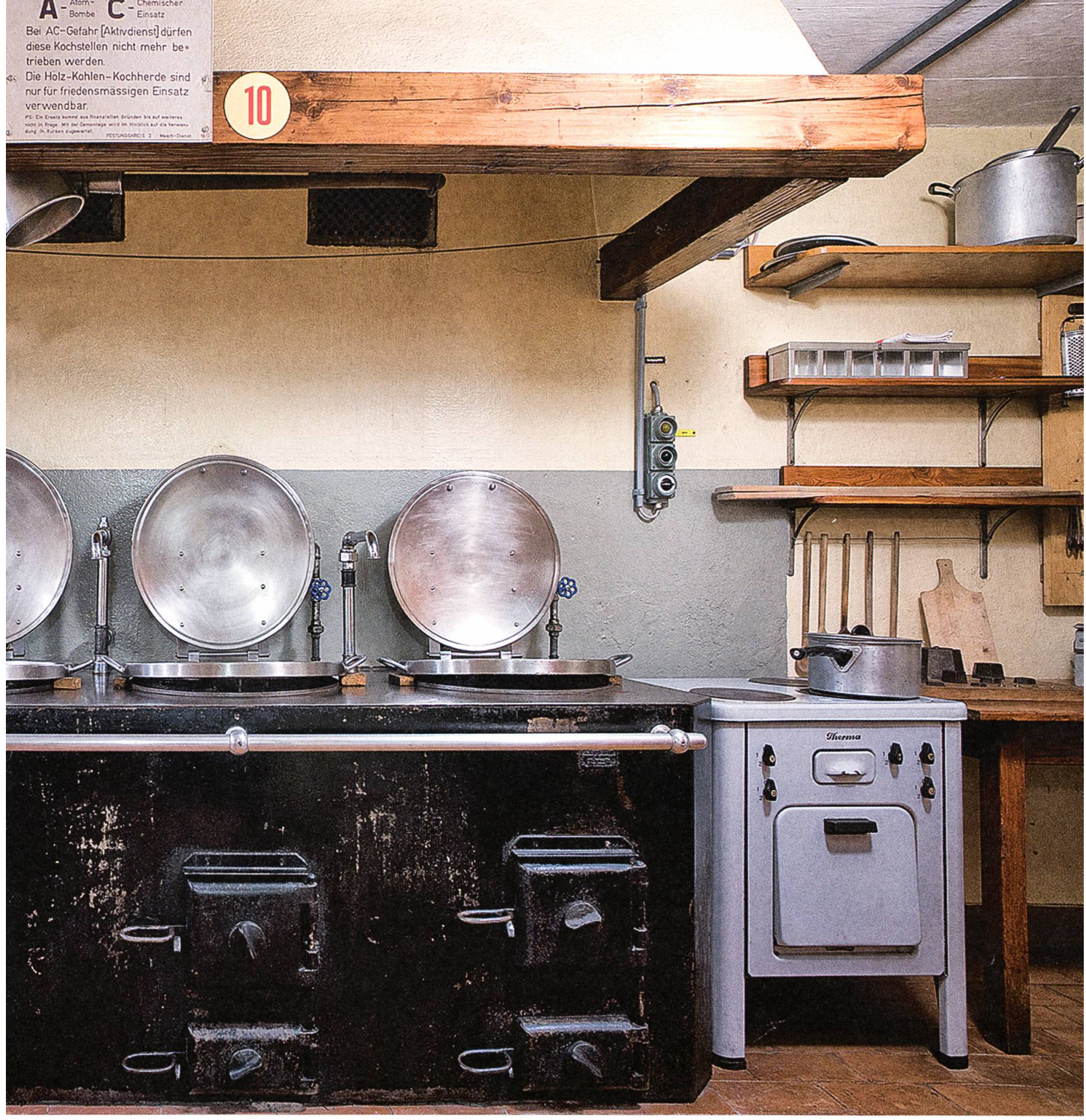
Die Originalküche. Museum Festung Fürigen, Stansstad.