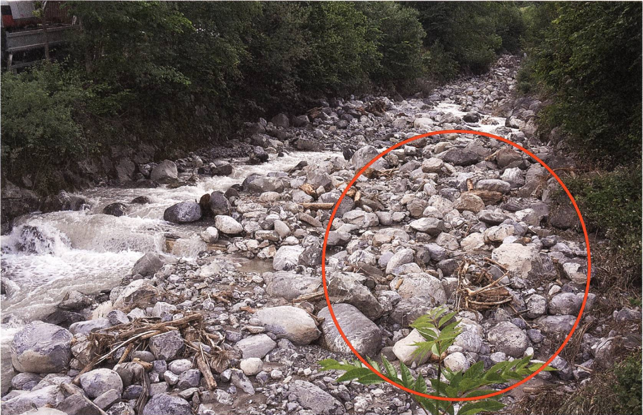
Sonntagmorgen: Das Gewitter vom Samstag hat extrem viel Geschiebe heruntergetragen ...

weiterhin auf Position. Eine Stunde lang bleibt die Wassermenge im Steinibach kritisch hoch, dann beginnt der Pegel zu sinken.