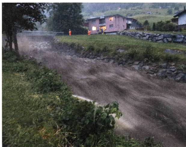
Der Steinibach fliesst knapp unter der Hofilibrücke hindurch und donnert am Quartier Steini vorbei.