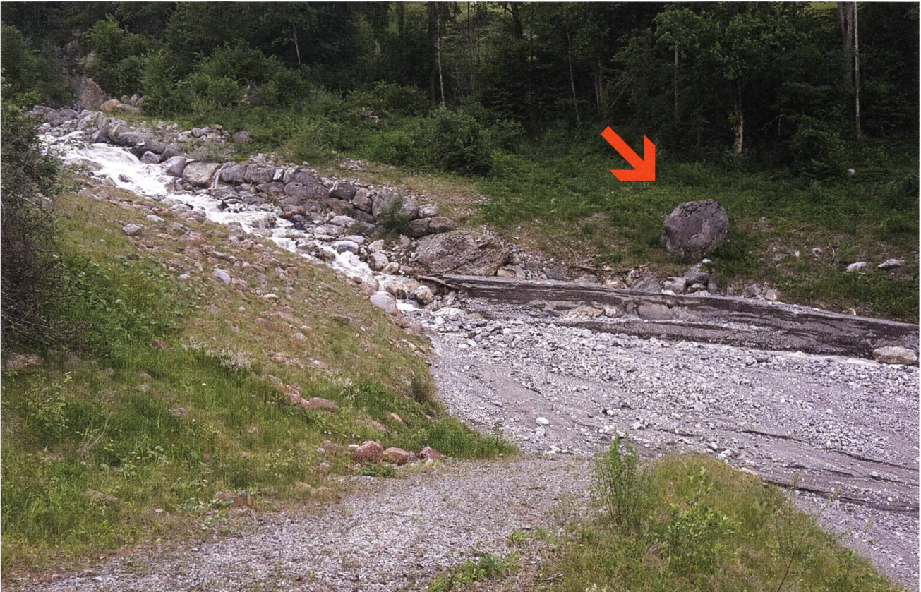
Am Samstag lagert der Steinibach viel Geschiebe im Sammler ab ...

damit er anschliessend besser abgestützte Entschiede fällen kann. Diese Option der erweiterten Lagebeurteilung fällt am Sonntag aus, dafür bleibt erstens keine Zeit und zweitens ist die Notlage offensichtlich.