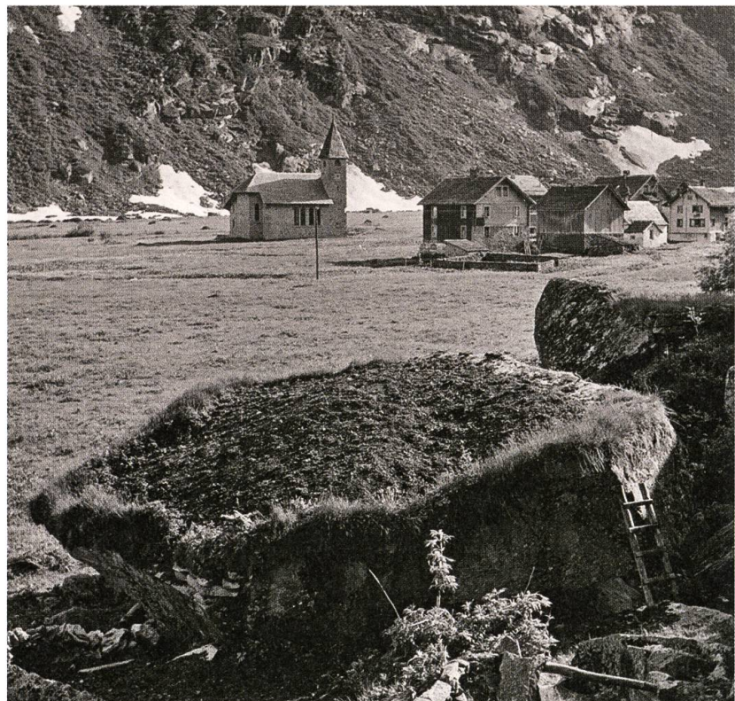
Kartoffelacker auf einem Findling. Göschenalp um 1930.

So, wie die Kartoffel im Alpenraum früher akzeptiert wurde als in grossen Teilen Europas, zeichnet sich die Ernährungsgeschichte Nidwaldens auch durch eine frühe Akzeptanz von weiteren Lebensmitteln aus, die man andernorts noch lange wenig schätzte. Dazu gehört unter anderem der Reis. Das hängt damit zusammen, dass Nidwalden früher noch als andere Innerschweizer Kantone den Getreideanbau im ausgehenden Mittelalter fast vollständig aufgab und sich auf die Milch- und Viehwirtschaft spezialisierte. Mit Rindern, Milchkühen und Käsen beliefert wurden