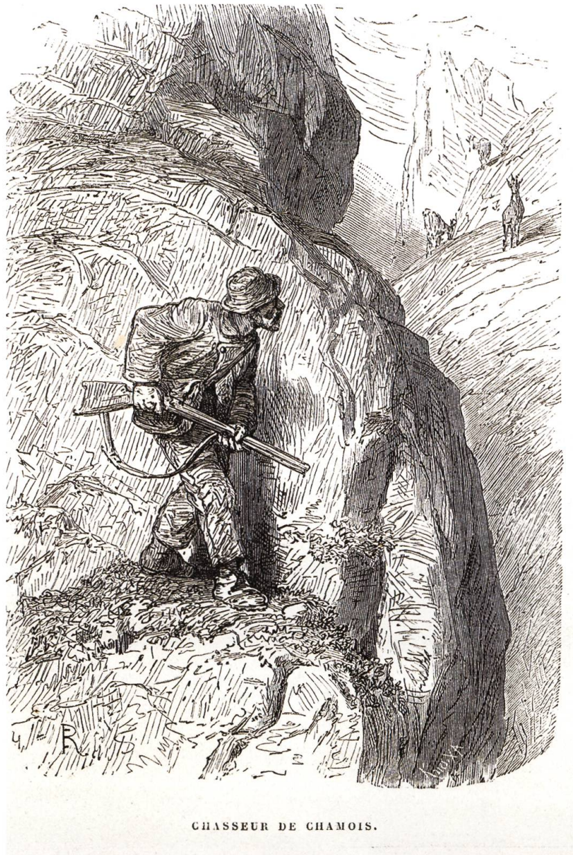
CHASSEUR DE CHAMOIS.

Innerschweizer Mostbirnen an: Theilersbirnen, Schweizer Wasserbirnen, Gelb- und Grünmöstler, Guntershauser oder Märxler Birnen. Birnen übrigens, die alle im Kanton Nidwalden heute noch vielerorts zu finden sind – auch wenn etwa die Grünmöstler an Beliebtheit verloren hat und viele Bäume gefällt wurden, da sie als Spätbirne erst gegen Ende Oktober oder Anfang November reif ist. Also zu einer Zeit, da die Bauern nach einer arbeitsreichen Erntezeit wenig Lust haben, Birnen gar aus dem Schnee zusammenzusammeln, für die sie heute kaum mehr Geld kriegen. Früher war das Sammeln der Spätfrüchte übrigens vor allem in grossen Familien Aufgabe der Kinder, wie heute noch die eine oder andere Nidwaldner Bäuerin erzählt.