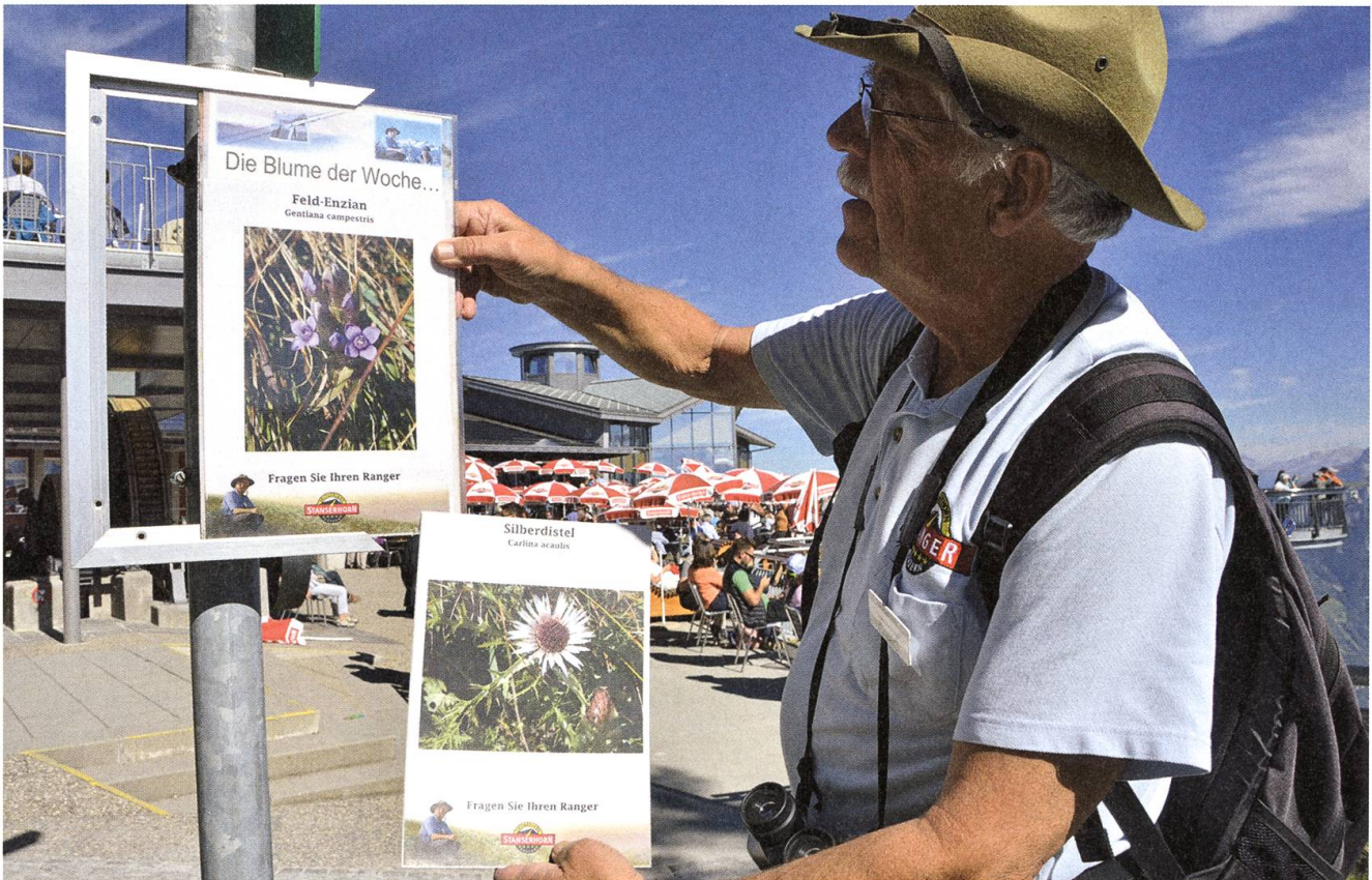
Von den Rangern auserkoren: Die Blume der Woche wird jeweils auf der Terrasse präsentiert.