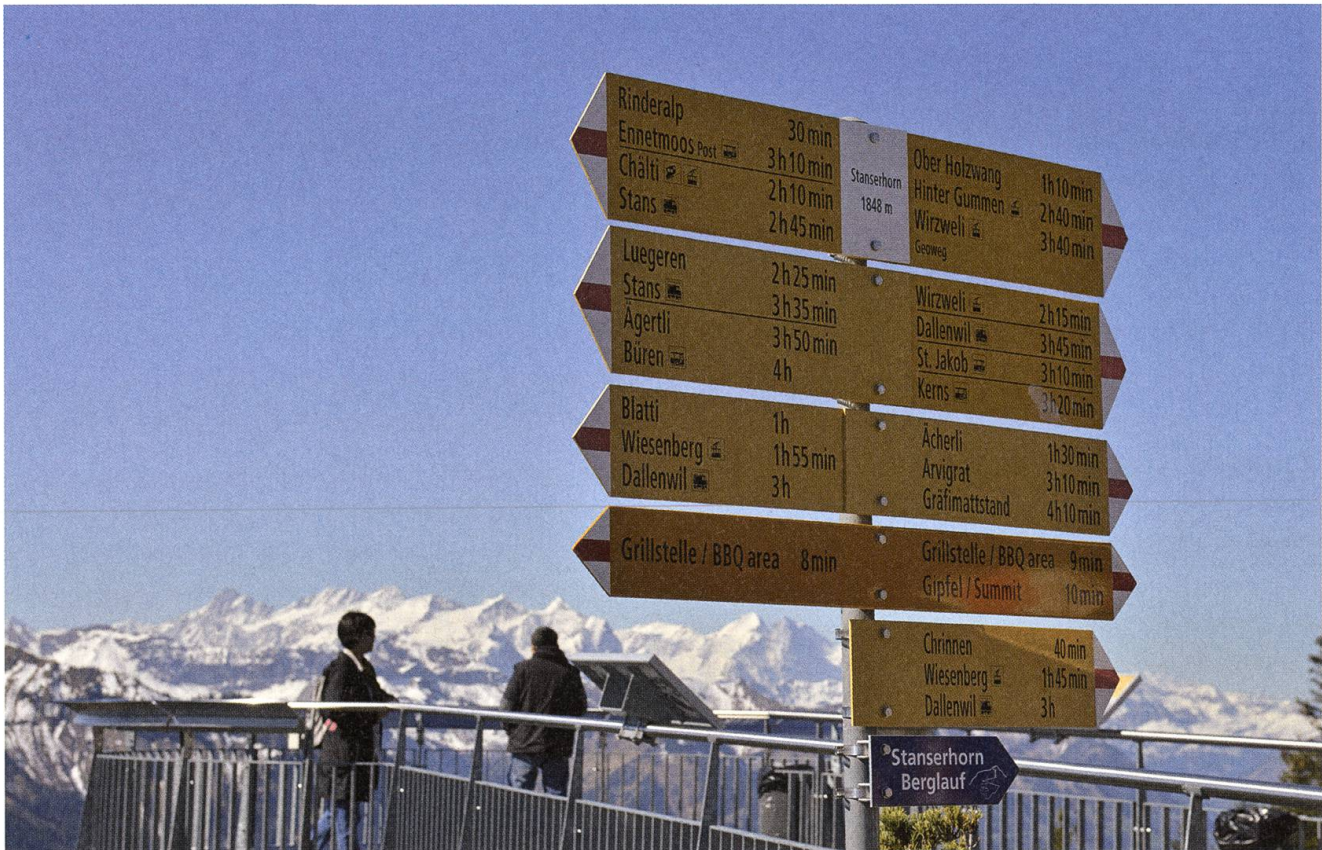
Wo ein Wille ist, da ist auch ein Weg – jedenfalls auf dem Stanserhorn. Der Ranger empfiehlt solides Schuhwerk.

Echo sowohl bei den Gästen als auch in der Branche überwältigend: Schon zum Ende der ersten Ranger-Saison wurde das Stanserhorn mit dem Tourismus-Milestone ausgezeichnet, dem Schweizer Tourismuspreis für herausragende Projekte.