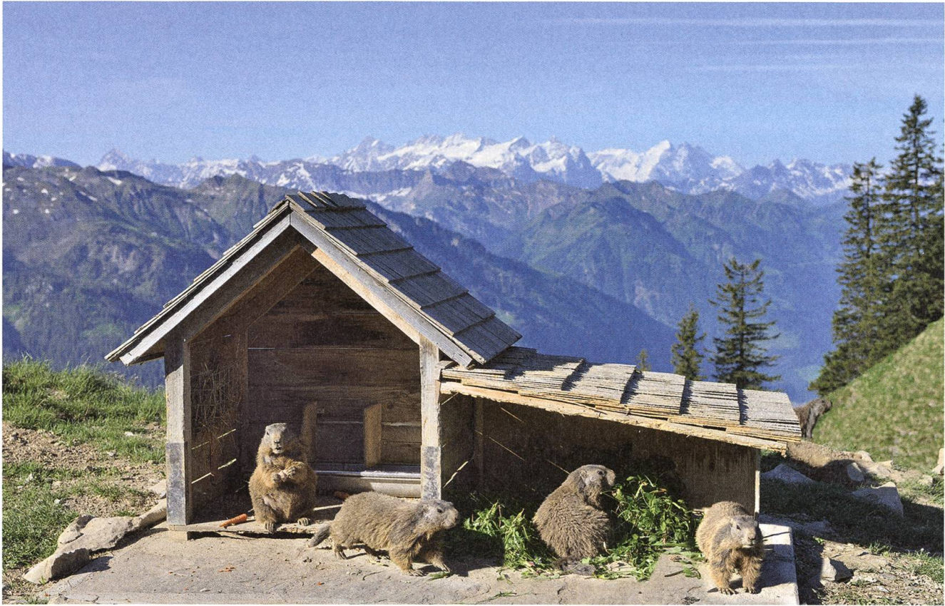
Bergfamilie: Sechs bis sieben Murmeltiere leben ganzjährig auf dem Gipfel des Stanserhorns.