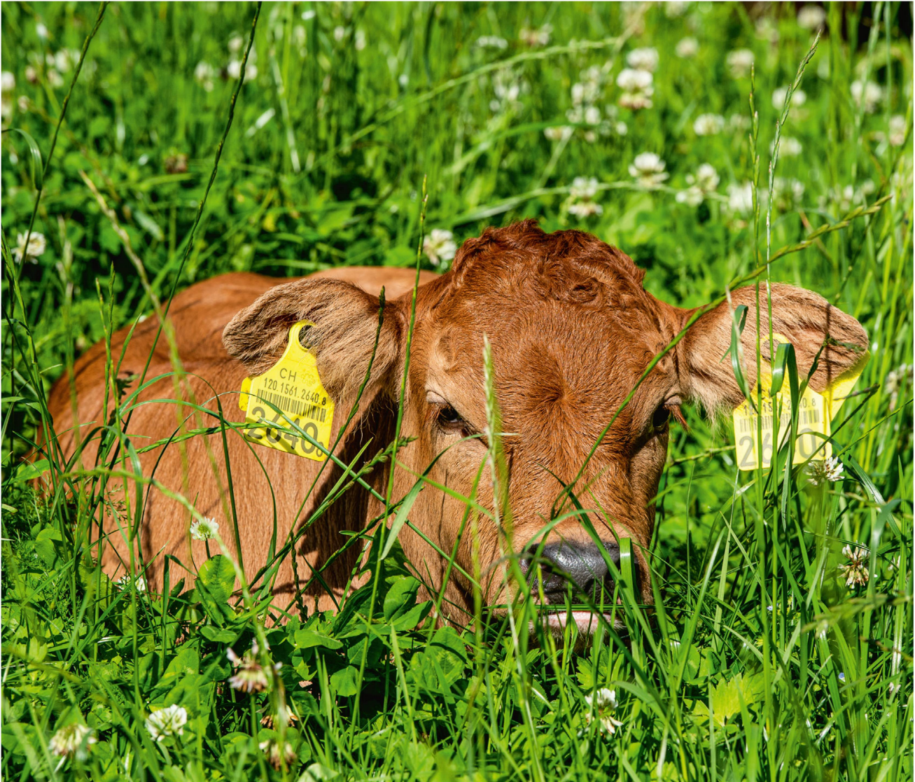
Glück im Gras: Die Kälber von Mutterkühen verbringen ihr Leben im Grünen.

eingestellten Kühen in Intensivhaltung, die nie ins Freie dürfen, sieht die Umweltbilanz weniger gut aus.