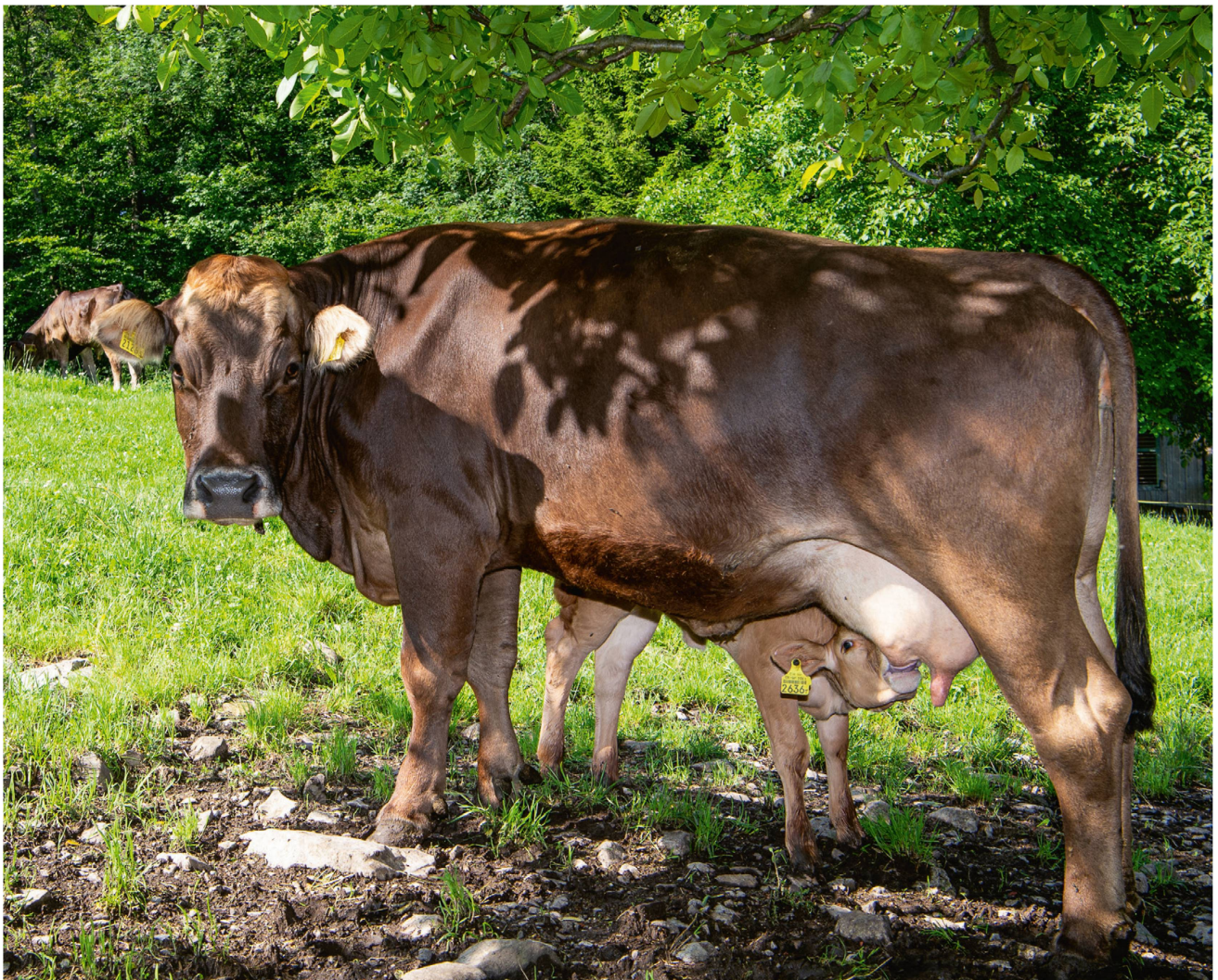
Die Kälber trinken nach Lust und Laune, bei der Mutter oder bei einer «Tante».

Anfänglich habe sie die Pakete auch ausgeliefert, eine Herausforderung, weil die Kühlkette ja keinesfalls unterbrochen werden darf. «Und die Leute kommen ja gern bei uns vorbei, um ein bisschen Landluft zu schnuppern.»