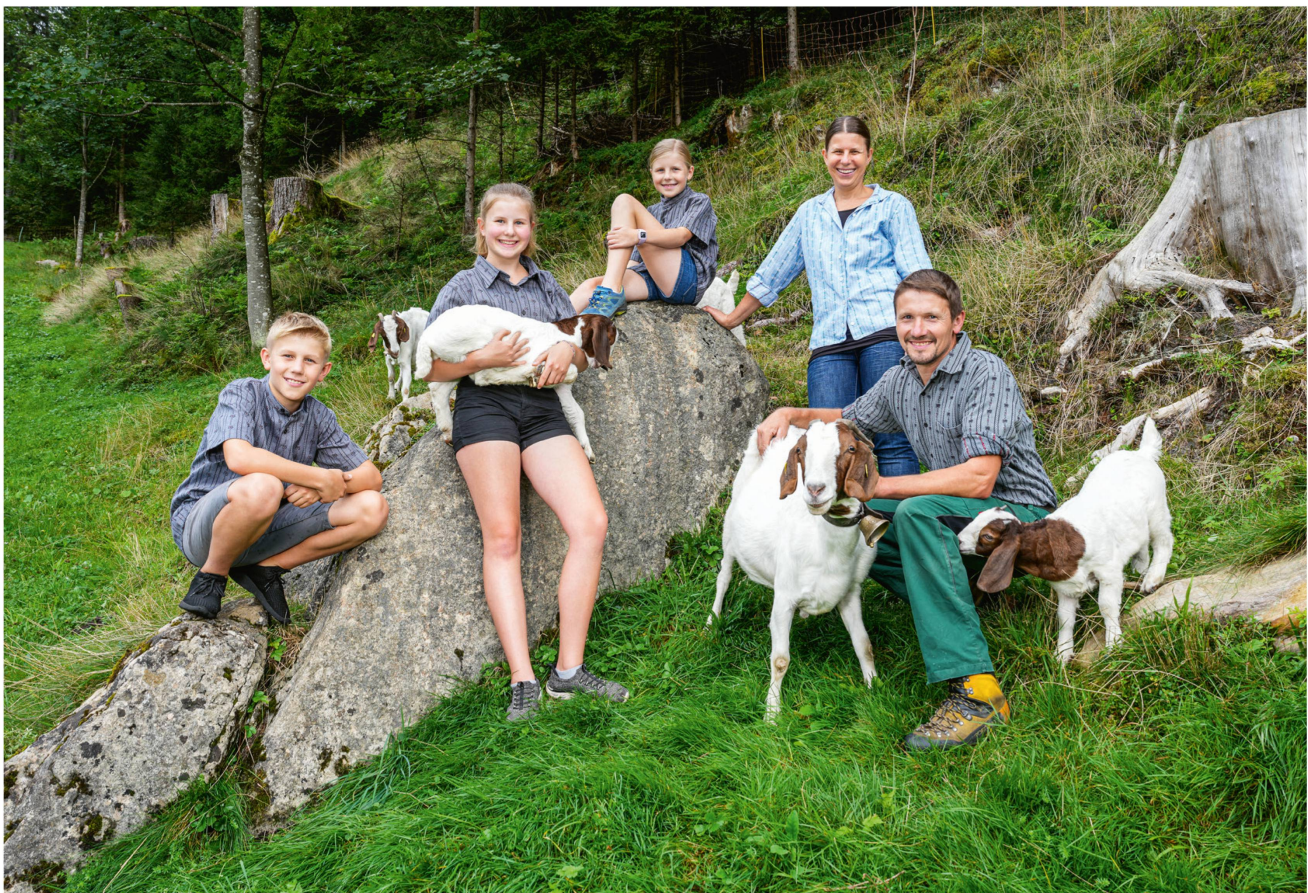
Bei Keisers im Eigenthal gilt auch für die Ziegen: Die Familie bleibt beisammen.

Die grosse Reise haben sie nachgeholt – und zudem weitere Yaks angeschafft, jetzt ist's eine Kleingruppe. Die haarigen, grunzenden Rinder passen perfekt in die wilde Landschaft am Pilatusfuss, man fühlt sich bei ihrem Anblick sofort auf ferne Gipfel oder in märchenhafte Gefilde aus «Herr der Ringe» versetzt. Allzu nah sollte man diesen exotischen Tieren nicht kommen, sie verteidigen – wie unsere heimischen Mutterkühe übrigens auch – ihre Jungen oder bedrängen einen aus lauter Neugierde. «Die Dynamik in Mutterkuhherden ist höher als bei Milchkühen, die Tiere sind lebhafter, handeln stärker nach ihrem Instinkt», erklärt