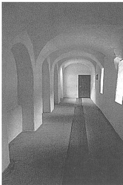
Kreuzgang, Südhof

Sicher eine vermehrte Publizität im In- und Ausland. Damit verbunden wohl auch eine Zunahme der Besucherzahlen in der Klosterkirche und im Klostermuseum (diese ist allerdings statistisch nicht erfasst worden). Vor allem die kaum oder ungenügend in-