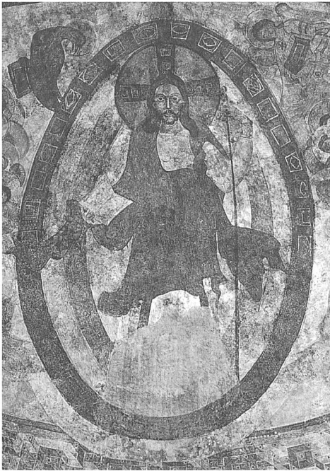
Kalotte der Mittelapsis, Salvator Mundi

schon um 1170, also aus der Zeit Kaiser Friedrichs I., freigelegt.