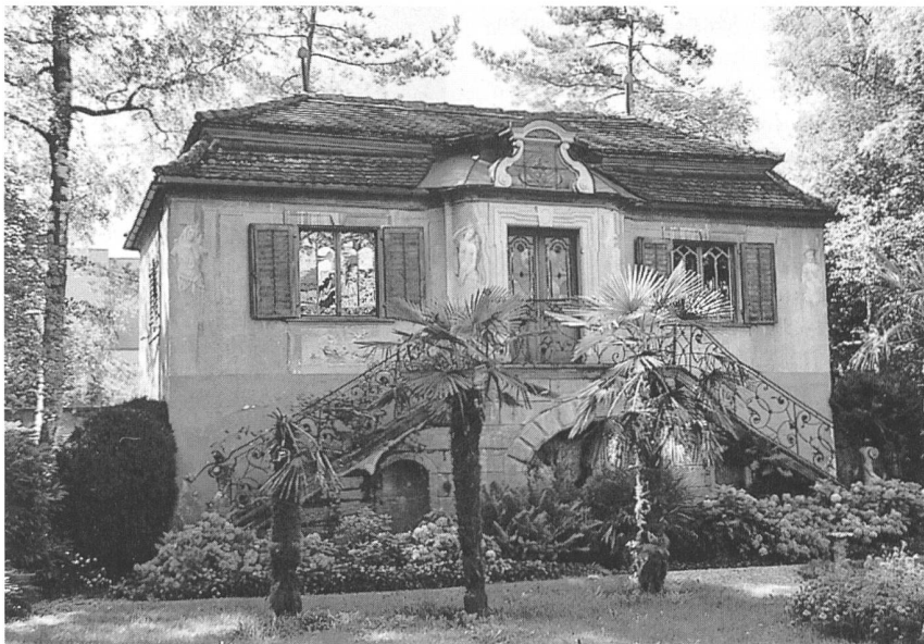
Der Löwenhof in Rheineck SG

Schloss Oberdiessbach bildet mit seinem Garten das bemerkenswerte Beispiel einer bernischen Campagne aus der Zeit des Barock. Das Anwesen ist seit elf Generationen im Besitz der Familie von Wattenwyl und wird mit grossem Einsatz gepflegt. Seit kurzem wird das interessierte Publikum (nach Voranmeldung) zur Besichtigung in Garten und Schloss eingeladen.