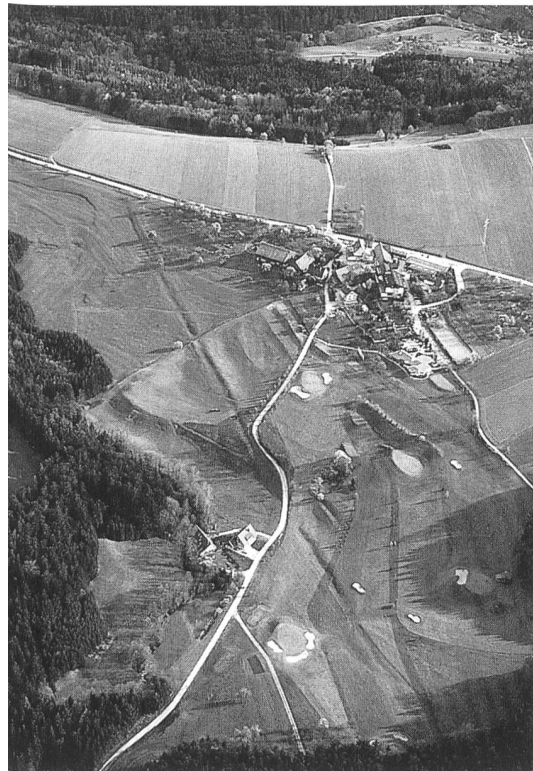
Der Limes beim Haghof, Gemeinde Alfdorf (Rems-Murr-Kreis)

Pfalz, Hessen, Baden-Württemberg und Bayern in einer einmaligen, gemeinsam lancierten Inventarisationskampagne. Die Kriterien für den Antrag auf weltweite Unterschutzstellung sind vielfältig: es handelt sich um das ausgedehnteste archäologische Denkmal in Europa und neben der Chinesischen Mauer um eines des längsten der Welt; vermessungs- und bautechnische Leistungen der römischen Erbauer sind herausragende Zeitzeugen; das Leben entlang der ehemaligen Grenzsperre wurde noch bis weit ins Mittelalter und in die Neuzeit hinein vom Wall geprägt (seien es durch