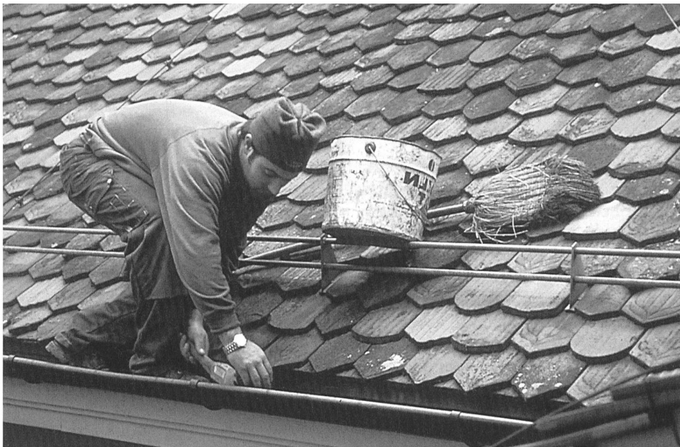
Kontinuierlicher Unterhalt: periodische Kontrolle des Daches, hier in der Berner Altstadt