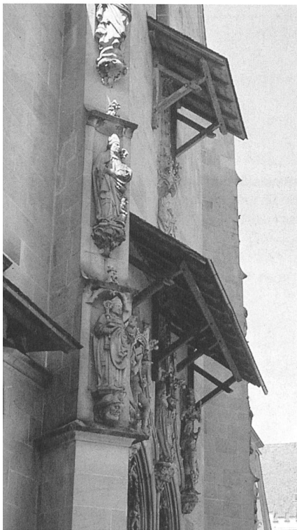
Schutzmassnahmen: Schutzdächer an der Kirche St. Oswald in Zug