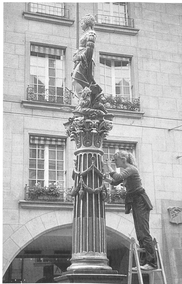
Kontrollvertrag: Beobachtung des Gerechtigkeitsbrunnens in Bern

Immer wieder ist von Fällen zu hören, in denen sich die Denkmalpflege für die Bauwilligen und die Gemeinde unerwartet, aus dem konkreten Anlass eines Abbruch- und Neubaugesuchs, für ein historisches Gebäude einsetzt. Sie stösst dann oft auf Unverständnis, wird als willkürlich und nicht nachvollziehbar handelnde Bauverhinderin gebrandmarkt.