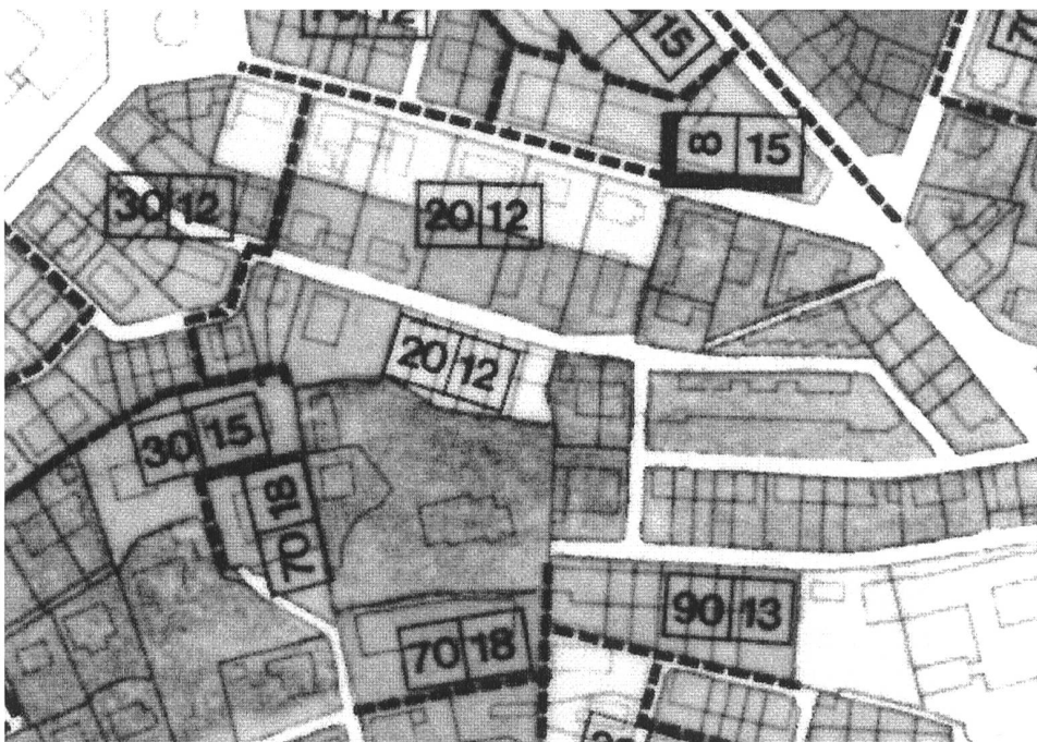
Grundordnung: Bauklassenplan der Stadt Bern, zulässige Gebäudeabmessungen an die bestehende Typologie angepasst (Gebäudelänge und -tiefe, bspw. 20/12) oder – in der Bauklasse E (Erhaltung) – das einzelne Gebäude als massgebend (im Plan ohne Bezeichnung). Ausschnitt vordere Länggasse, Bern.

Ein wichtiges Mittel vorbeugender Denkmalpflege, die Schaffung von Anreizen, wird in der Schweiz bedauerlicherweise wenig angewendet. Im Rahmen von Überbauungsordnungen wird häufig eine Mehrwertabschöpfung vorgesehen, eine Abgeltung des finanziellen Mehrwerts, der durch die Planung entsteht, an die Gemeinde. Dabei können Festlegungen getroffen werden, die der Eigentümerschaft beispielsweise durch den teilweisen Verzicht auf die Mehrwertabschöpfung finanzielle Vorteile verschaffen, wenn sie ein bestimmtes Gebäude nicht abbricht, sondern es einer neuen Nutzung zuführt und restauriert.