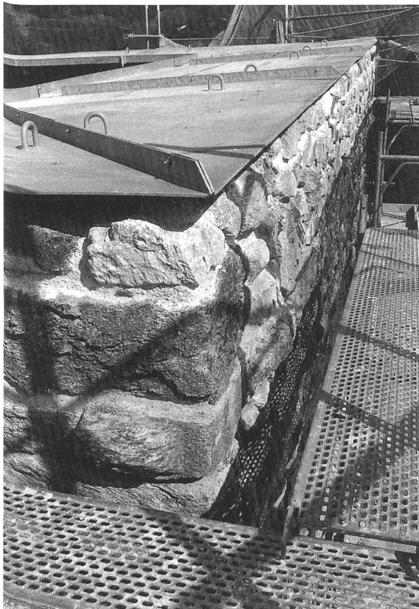
Schutzmassnahmen: Abdeckung der Mauerkrone der Ruine Jörgenberg

Bei besonders heiklen Denkmälern lohnt es sich, einen Schritt weiter zu gehen. Mit dem Abschluss eines Kontrollvertrags mit einer spezialisierten Firma wird sichergestellt, dass periodisch, ohne besondere Aufforderung die notwendige Zustandserhebung durchgeführt und Meldung an die öffentliche oder private Eigentümerschaft erfolgt. So ist gewähr-