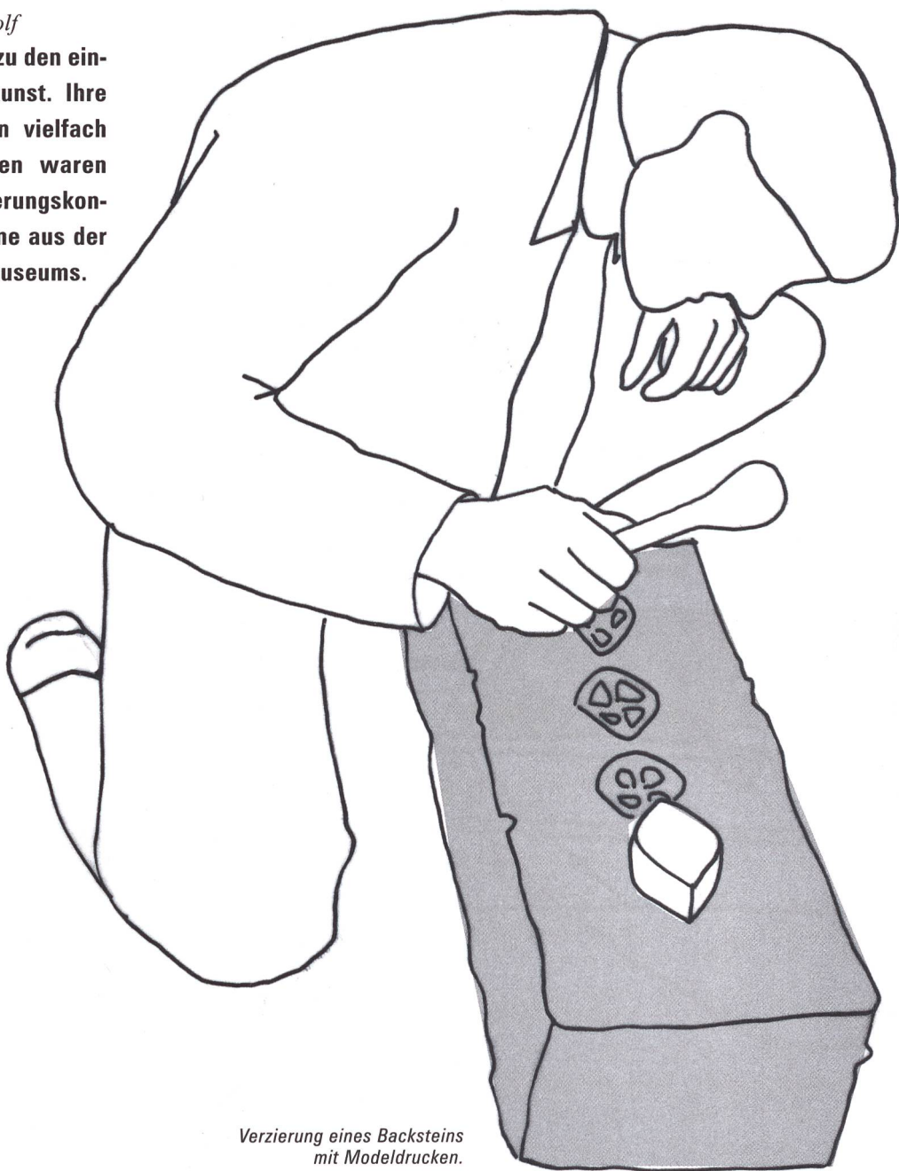
Verzierung eines Backsteins mit Modelldrucken.

Die Backsteine von St. Urban LU gehören zu den eindrucklichsten Beispielen der Backsteinkunst. Ihre Geschichte und ihre Herstellung wurden vielfach untersucht. Interdisziplinäre Forschungen waren Grundlage für ein umfassendes Konservierungskonzept für einige stark gefährdete Backsteine aus der Sammlung des Schweizerischen Landesmuseums.