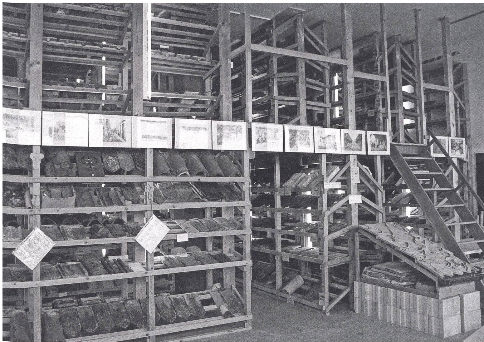
Museum und Depot zugleich: Der Sammlungsraum im Industriequartier von Cham.