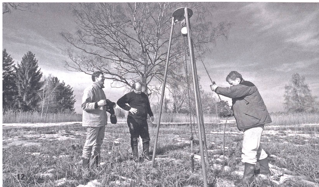
Trockeneis Sondierungen im Randbereich des Pfäffikersees durch Mitarbeiter der Kantonsarchäologie Zürich.