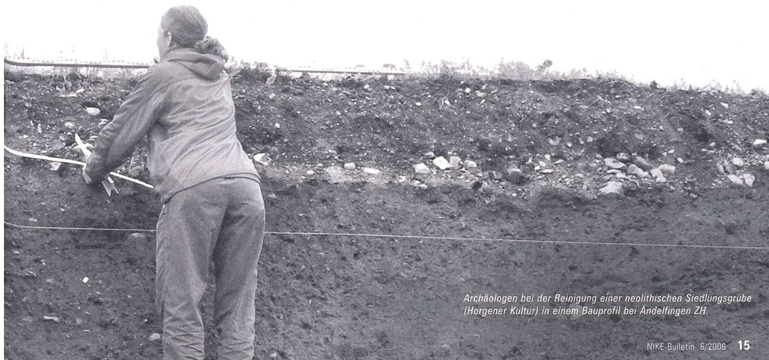
Archäologen bei der Reinigung einer neolithischen Siedlungsgrube (Horgener Kultur) in einem Bauprofil bei Andelfingen ZH.

Au moyen de la prospection subaquatique, on essaie de dresser des inventaires aussi complets que possible des restes d'habitats, de ponts, d'installations portuaires ou d'embarcations naufragées qui parsèment les zones côtières des lacs suisses et de rendre compte de l'état de conservation de ces objets. Les méthodes telles que l'investigation géoélectrique, magnétique ou par radar d'exploration du sous-sol appliquent des techniques empruntées à la physique et permettent de «voir» le contenu du sous-sol, sans devoir effectuer de fouilles.