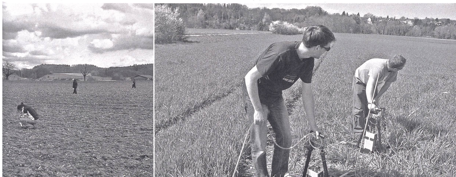
Radarmessungen im Bereich des keltischen Oppidums von Rheinau ZH durch Mitarbeiter des Institutes für Geophysik der ETH Zürich.

Georadar: Mit dem Radargerät werden elektromagnetische Wellen in den Boden geschickt, welche an natürlichen oder anthropogenen Schichtgrenzen reflektiert werden. Die zurücklaufenden Echos werden von Messsonden registriert und können als senkrechte Bodenprofile dargestellt werden. Mit Hilfe des Computers lassen sich aus zahlreichen solchen Bodenprofilen dreidimensionale Bilder des Untergrundes darstellen. Der Einsatz von Radargeräten hat sich in der Stadtkernforschung als besonders hilfreich erwiesen.