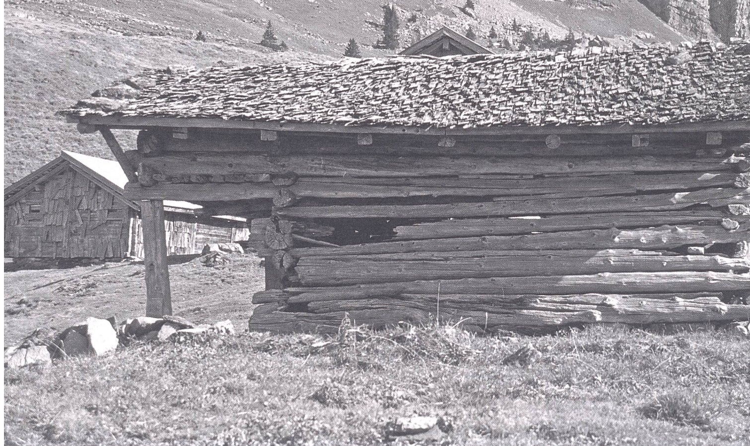
Abb. 3: Brienz BE, Axalp, Litschentelli. Melchhüttli kurz vor dem Zerlegen im Jahr 2000. Die gesamte Bausubstanz wurde vom Archäologischen Dienst Bern vor dem Abtransport eingehend dokumentiert.

lediglich als Schutz- und Schlafplatz dienenden Gebäude meist am unteren Ende von Geröllhalden, dort, wo die grossen Blöcke liegen blieben. Bevorzugt wurden die Hütten im Schutze von grossen Sturzblöcken gebaut, die als Rückwand dienten und gleichzeitig Schutz vor Steinschlag und Lawinen boten. Pferche wurden nach Möglichkeit ebenfalls unter Einbezug von grösseren Sturzblöcken errichtet. In den Pferchen wurden die Schafe und Ziegen nicht nur bei schlechtem Wetter, sondern vor allem über Nacht eingesperrt, um sie vor wilden Tieren und Viehräubern zu schützen.