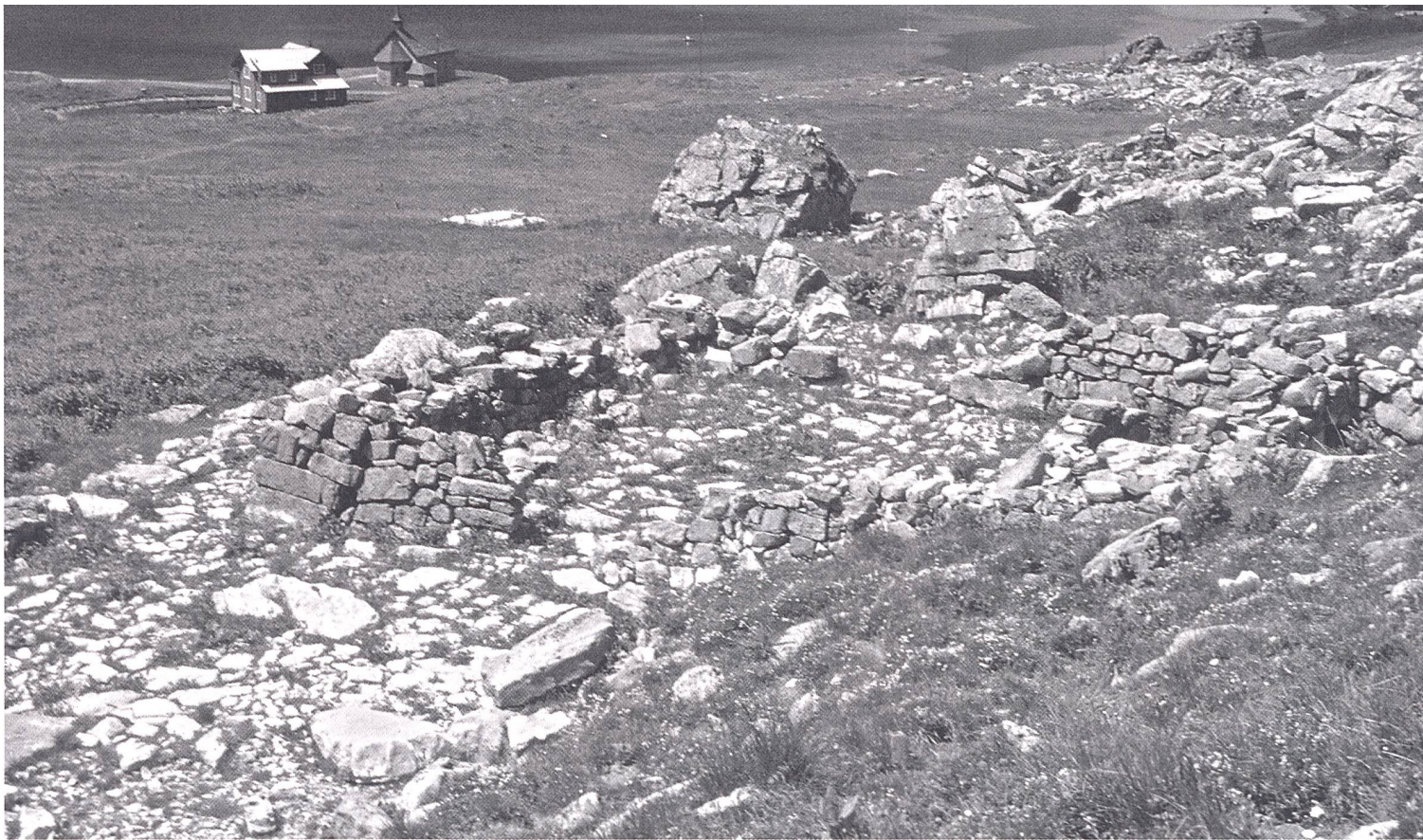
Abb. 2: Kerns OW, Melchsee-Frutt, Wüstungsplatz Müllerenhütte. Ruine einer grossen Alphütte mit integriertem Stall und gepflästertem Vorplatz, vermutlich aus dem 16. Jahrhundert.

Generation. Selbsterlebtes, Hüttengeschichten über die Altvorderen, Berichte über Unglücke, sonderbare Begebenheiten und Sagen gehen so in nächster Zukunft unwiederbringlich verloren. Besonders betroffen davon sind auch die Flurnamen, hatte doch fast jede auffällige Landmarke einer Alp ihren eigenen Namen.