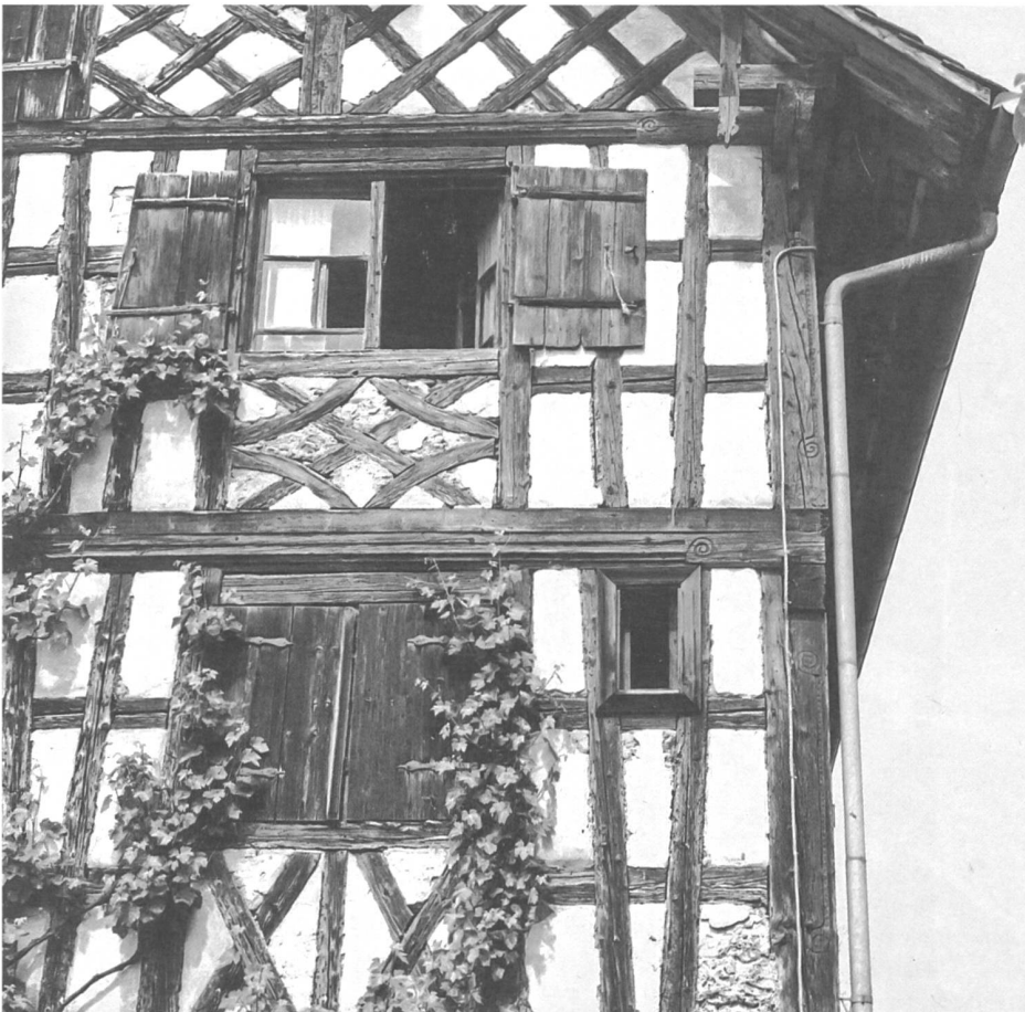
Holzspezifische Eigenschaften können geschickt ausgenutzt werden, so zum Beispiel Krummwuchs für gebogene Streben und Trocknungsverzug für das Einspannen von Fachwerkfüllungen. Bild: Münsterlingen (TG).

Was nützen eigentlich Verzierungen an hölzernen Gebäuden? Oder anders gefragt: Inwiefern führen handwerkliche Materialbearbeitungen zu Formen, die benutzer-