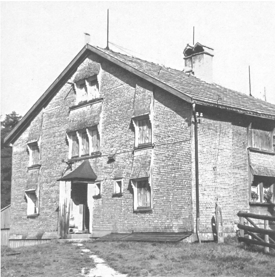
Wandverkleidungen aus Brettern oder Schindeln bilden nicht nur Witterungsschutz und Isolation, sondern sie strukturieren und verfeinern auch die Oberflächen von Konstruktionshölzern. Bild: Teufen (AR).

freundlich, dauerhaft und qualitativ sind? Einfachste Zierformen, etwa die Fase an Kanthölzern, lassen sich bereits an Bauten aus dem 13. Jahrhundert feststellen. Die Absicht dabei, relativ scharfe Balkenkanten mit dem Ziehmesser zu brechen, könnte sein, Verletzungen sowohl bei Hausbewohnern als auch am Bauteil selber zu vermindern. Mit wenig menschlichem Gestaltungswillen entsteht daraus bereits eine kleine Verzierung. Ähnliches gilt bei der Eiche für den weichen, farblich vom Restholz sich abhebenden Splint. Bei Türpfosten beispielsweise konnten solche Unterschiede störend wirken. Eine breite Zierfase macht aus der Not eine Tugend.