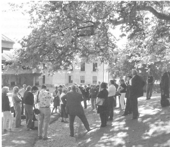
Ein rundum gelungener Anlass: Die Lancierung des Denkmaltages im Schlosspark von Barberêche.

Die Vorbereitungen liefen ab dem Frühjahr. Mit Lignum, dem Verband der Schweizer Schreinermeister und Möbelfabrikanten VSSM und dem Bund Schweizer Architekten BSA