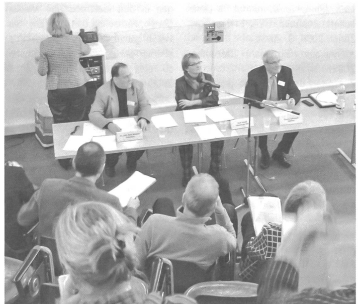
Die 18. ordentliche Delegiertenversammlung fand am 16. März 2006 im Vortragsaal der Stadt- und Universitätsbibliothek Bern statt.

«Europäischer Tag des Denkmals/ Journées européennes du patrimoine/ Giornate europee del Patrimonio» Offizielle gesamtschweizerische Broschüre zum Denkmaltag unter dem diesjährigen Slogan «Gartenräume – Gartenträume/Les jardins, cultures et poésie/Giardini tra sogno e realtà» vom 9./10. September 2006, gemischt dreisprachig deutsch, französisch und italienisch, Bern 2006, 84 S., ill., Auflage 63 000 Exemplare.