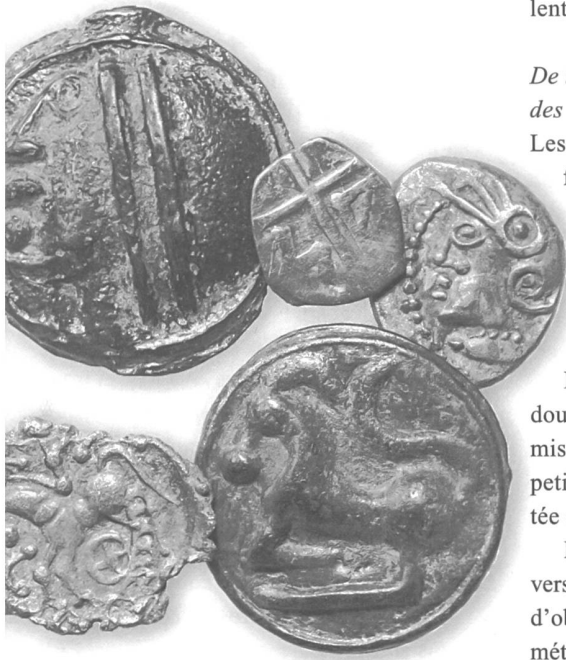
Potins (bronze coulés) dits «à la grosse tête», 2 quinaires «de KALETEDV» et une petite obole massaliote en argent.

Le lieu de culte découvert sur la colline du Mormont, à ce jour unique en Gaule, présente une des plus grandes concentrations de