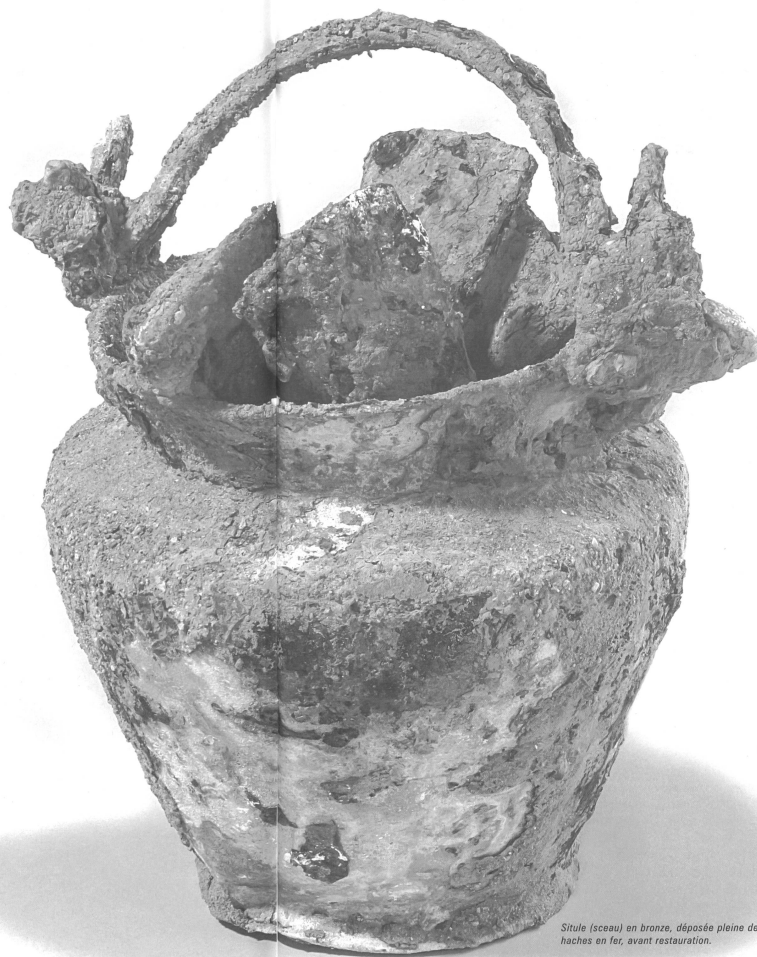
Situle (seau) en bronze, déposée pleine de haches en fer, avant restauration.

Le sauvetage complet du site, qui s'est étendu sur plus de 9 mois, a pu être réalisé à la faveur d'une heureuse conjonction météorologique, mais surtout grâce à la coopération et contribution de l'exploitant, qui a constamment adapté son programme de travaux aux nécessités de la fouille archéologique. La multiplication des découvertes et l'extension constante de la surface des investigations ont constitué la principale difficulté de cette opération.