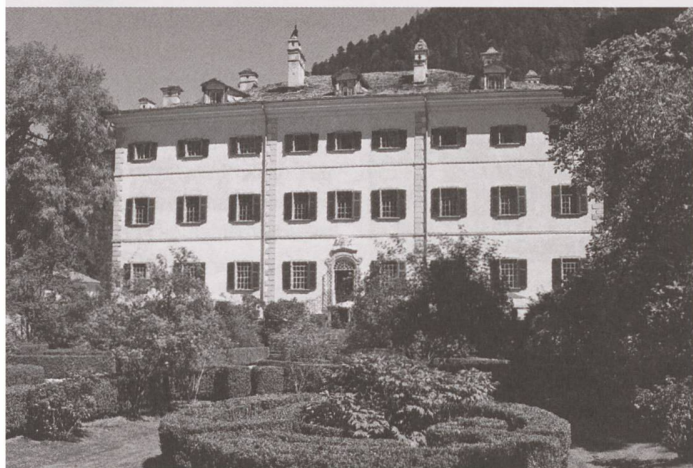
Gartenanlage im Stil der Spätrenaissance: der Garten des Palazzo Salis in Bondo.