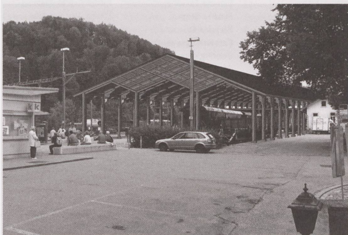
Wieder in ursprünglicher Funktion – so soll sich die Perronhalle dereinst in Bauma präsentieren.