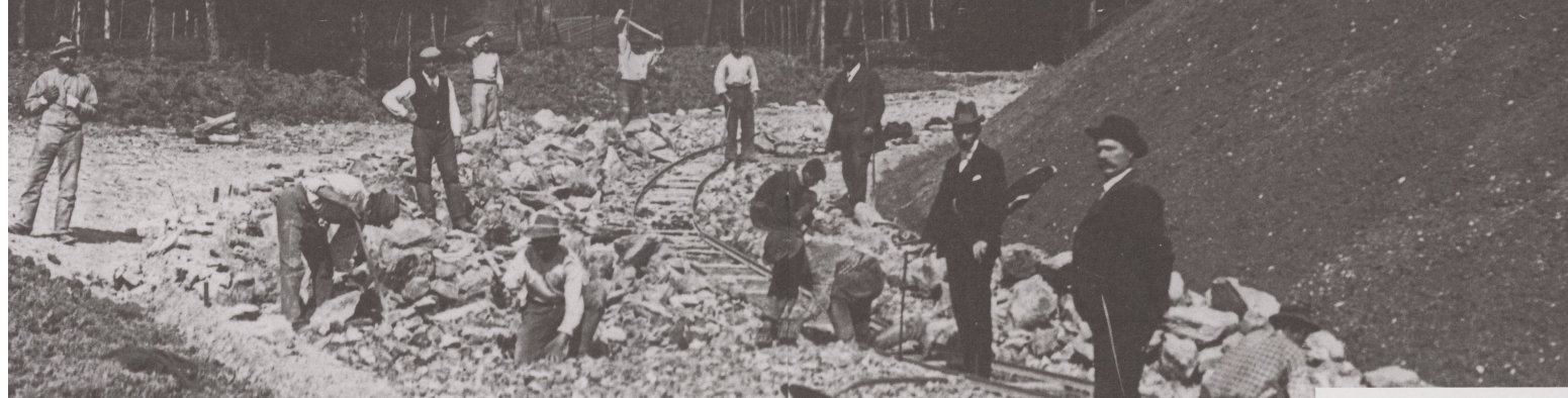
Steinklopper in Meilen um 1902. Ein Steinbett konnte damals nur mit Schmalspurschienen einer Baustellenbahn erschlossen werden. Erst nach dem zweiten Weltkrieg wurden dank der nun massiv eingebaute massiveren Schotterstrassenbaustellen für Lastwagen befahrbar.

D abei ergab sich im Strassenbau häufig ein Nebeneinander von Technikkonstanz und Technikinnovation. Welche der Techniken angewandt wurden, war nicht nur eine Frage des bau- und ingenieurtechnischen Wissens, sondern auch regionaler Traditionen, des örtlich vorhandenen Materials, des möglichen respektive sinnvollen Aufwands, der topographischen Situation, der Erfordernisse des Verkehrs, der Unterhaltsverhältnisse und schliesslich auch der sozialen Bedingungen. Der vorliegende Artikel möchte die Veränderungen im Strassenbau in diesen verschiedenen Bezügen skizzieren.