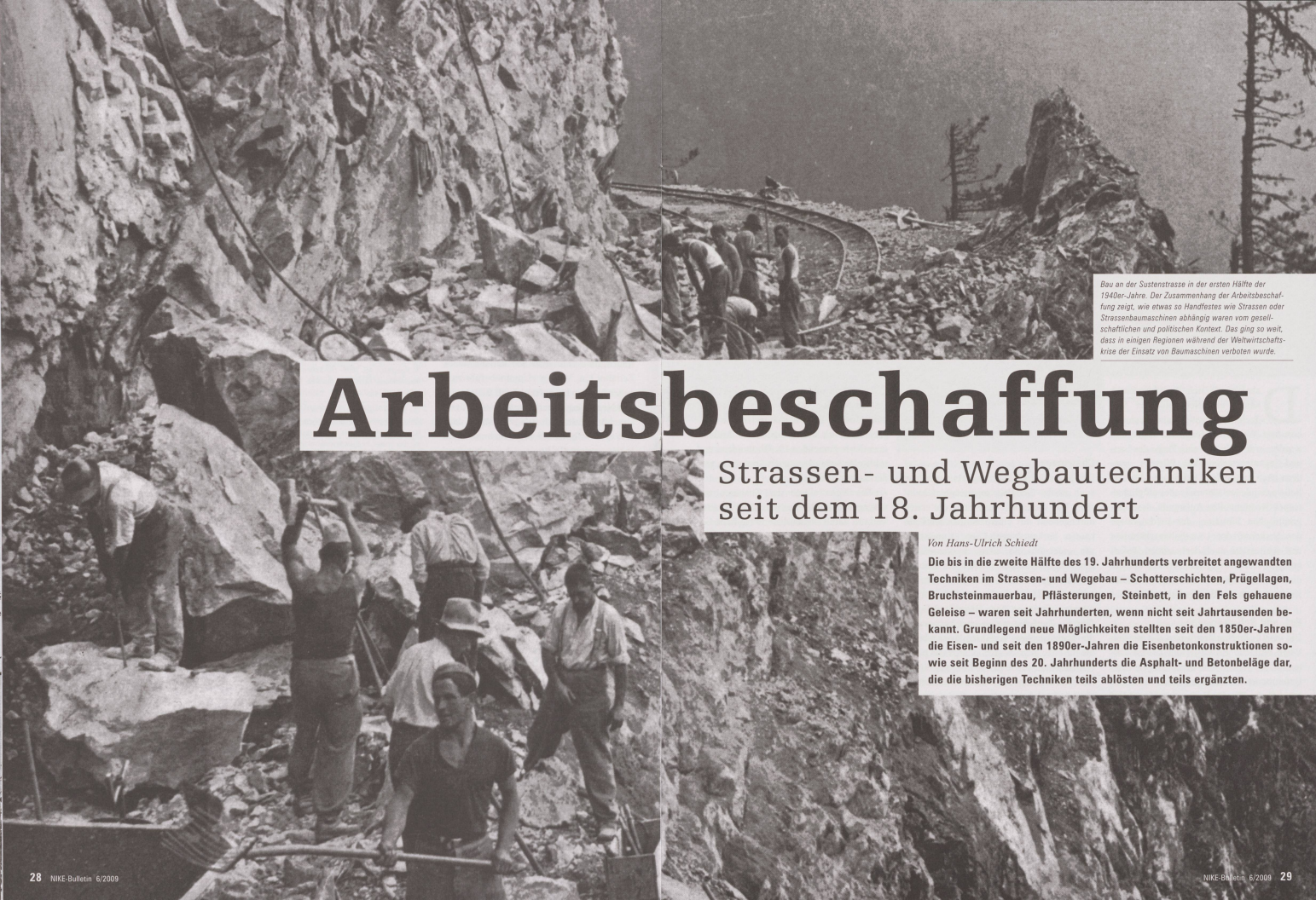
Bau an der Sustenstrasse in der ersten Hälfte der 1940er-Jahre. Der Zusammenhang der Arbeitsbeschaffung zeigt, wie etwas so Handfestes wie Strassen oder Strassenbaumaschinen abhängig waren vom gesellschaftlichen und politischen Kontext. Das ging so weit, dass in einigen Regionen während der Weltwirtschaftskrise der Einsatz von Baumaschinen verboten wurde.