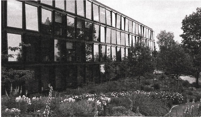
Die «Blumenberge» bieten überbordende Üppigkeit und Farbenpracht zu allen Jahreszeiten – gespiegelt in den Fenstern des Neubaus.