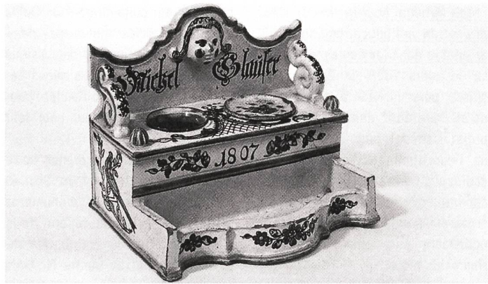
Bärswiler Tintengeschirr mit aufgelegtem Köpfcen und typischer Bemalung (Blümchen und Rocailles). Geschirre dieser Art wurden zwischen 1792 und 1821 nur in Bärswil produziert.