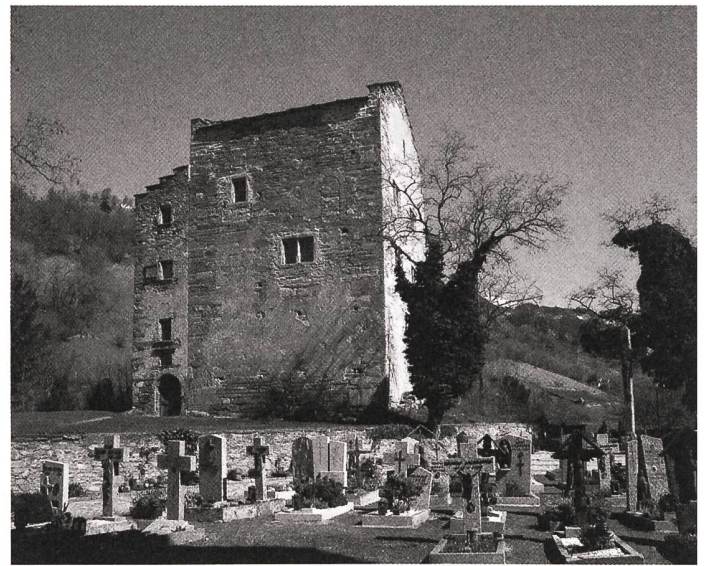
Das Zehndenrathaus in Raron VS.

Gesetzes wegen zugewiesenen Gutachterfunktion haben sie sich auch zum vorliegenden Fall in einem unabhängigen Fachgutachten geäußert. Erwähnenswert ist dieses Gutachten, weil es – entgegen der Auffassung der kantonalen Denkmalpflege – das aus einem nach SIA-Ordnung durchgeführten Wettbewerbsverfahren hervorgegangene Bauprojekt in der vorliegenden Form ablehnt und zur Überarbeitung empfiehlt. Dies erfolgte gestützt auf den Augenschein und eigene Analysen der Kommissionen sowie aufgrund der klaren Vorgaben des ISOS, das der ganzen Altstadt sowohl in der Kategorie der räumlichen wie in der Kategorie der architekturhistorischen Qualitäten die höchste Bewertung zuspricht. Es empfiehlt sich deshalb, im Vorfeld der Formulierung von Wettbewerbsvorgaben die gültigen Rechtsgrundlagen und Fachgrundsätze zu berücksichtigen und diese ins Pflichtenheft einfließen zu lassen. Dadurch kann