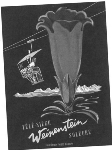
Werbeplakat aus den Anfängen des Weissenstein-Sessellifts.

Der Schweizer Heimatschutz kämpft seit einem halben Jahrzehnt um den Erhalt des Sessellifts am Solothurner Hausberg, dem Weissenstein. Die einzigartige Anlage begeistert nicht nur Technikinteressierte sondern steht sinnbildlich für einen nachhaltigen Tourismus in einer geschützten Landschaft.