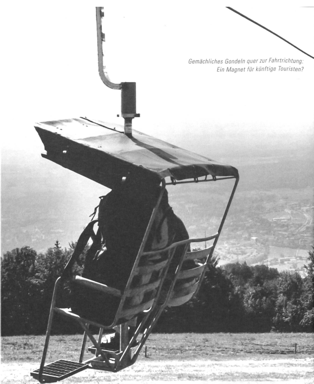
Gemächliches Gondeln quer zur Fahrtrichtung: Ein Magnet für künftige Touristen?

Das gemächliche Gondeln in den quer zur Fahrtrichtung stehenden Zweiersesseln war bis zur Stilllegung der Weissenstein-Bahn ein Erlebnis, das zum Naherholungsgebiet am Jurasüdfuss passte und bereits auf der Fahrt Ruhe und Entspannung in einer immer hektischeren Zeit bot. Das Ge-