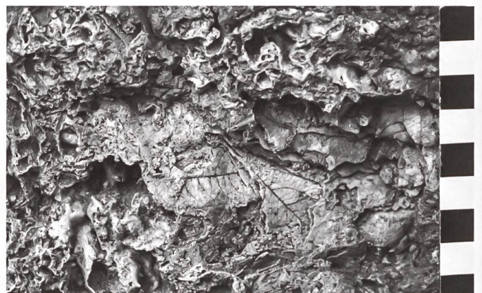
Tuf calcaire de la Tuffière, Fribourg. Escaliers du Court-Chemin/Kurzweg.