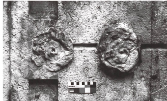
Ammonites dans le calcaire de Grandvillard, Perron du portail nord de la cathédrale de Fribourg.