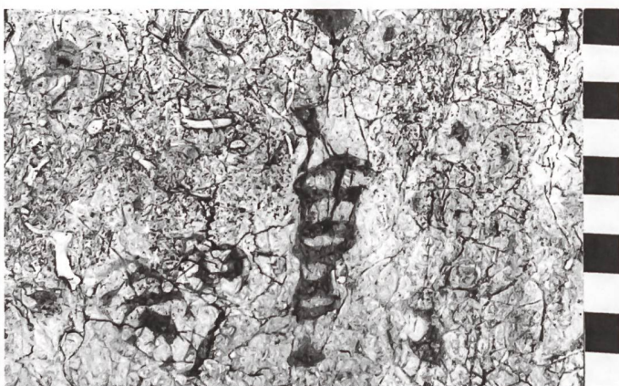
Nérinées dans un bloc de calcaire de Soleure très similaire à celui de la colonne octogonale de la fontaine N-D du Rosaire de Fribourg.