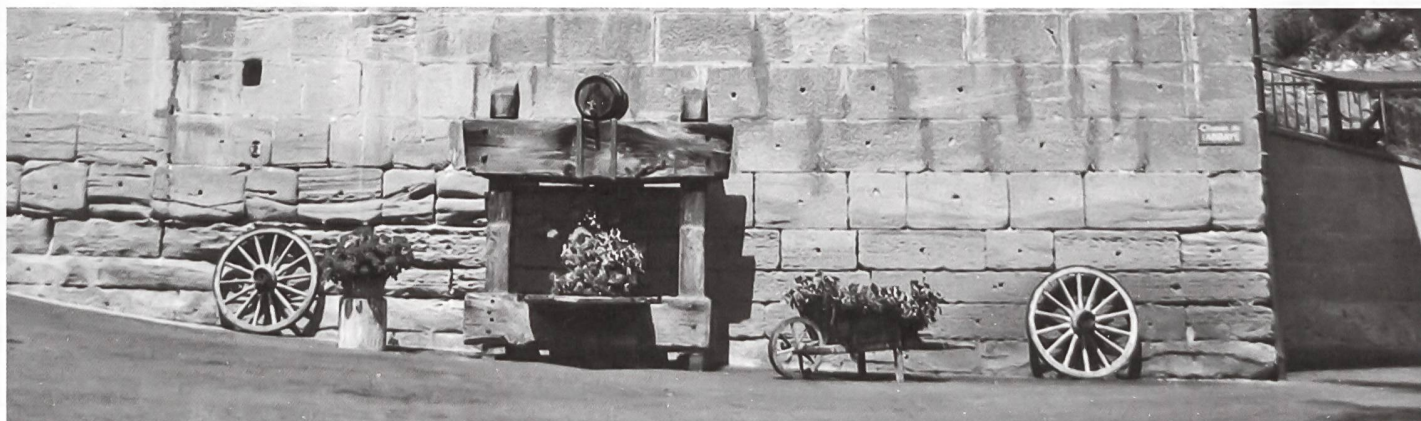
Chemin de l'Abbaye (de la Maigrauge), Fribourg. Ferme construite en molasse burdigalienne.