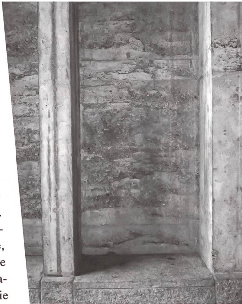
Der Originalbeton der Antoniuskirche zeigt grossflächig Kiesnester und offene Stellen.

Seit 1975 überwiegt die Zahl von Werbeanzeigen für Betonsanierungen deutlich jene der Praxisberichte. Viele Sichtbetonbauten wurden in den letzten 30 Jahren saniert. Viele fehlen in den Bauinventaren, da sie nicht zu den Ikonen der Moderne und den denkmalschützerisch bedeutenden Solitärebauten gehören. Dazu zählen Bauzeugen des Woh-