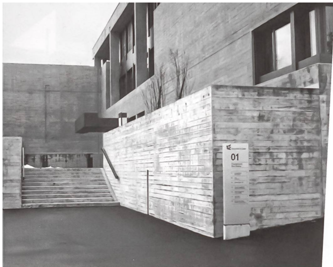
Bei der Universität St. Gallen erfolgte die Betonsanierung nach dem Grundsatz «So wenig wie notwendig».

welche Risse verursachten. Die Baumeister hatten Stampfbeton als Ortbeton genutzt. Er war sehr porös, Mischung und Siebkurven waren höchst unterschiedlich. Die Tonhohlkörper des Ziegelkerns störten den Vorgang des Betonierens, Vibratoren fehlten bei der Applikation des Betons gänzlich, sie waren damals in der Schweiz noch unbekannt. Kiesnester bildeten sich aus. Bei den Schalbretterstössen drang Wasser in die Fassadenwände ein. Die Armierungseisen waren teilweise ungenügend überdeckt. In der Folge rosteten sie, da und dort platzte der Beton ab. Die Beton-Querstäbe der Fenster begannen abzusanden. Die zunehmende Luftverschmutzung verschlimmerte die Situation. Salze und Kohlendioxid drangen aus der Luft und bei jedem Regenschlag in die Betonschalen ein. Die Karbonatisierung der Oberflächen verstärkte sich. Der pH-Wert sank von 12,5 unter 9 – der Beton wurde weich, verlor seine Festigkeit und die Fenster drohten aus den Fassaden zu stürzen. Bereits 1950 musste der Glockenturm mit Spritzbeton gesichert werden. 1962 wurden Risse im Kirchenschiff ausgebessert. 1973 folgte die Sanierung des Turms und der gealterten Eingriffe aus den Jahren 1950 und 1962.