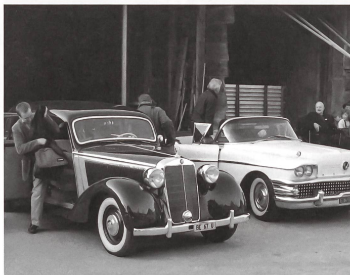
Grâce à la Fédération Suisse des Véhicules Anciens un service de taxi avec des véhicules historiques pouvait être offerts aux participant-e-s de l'assemblée générale du Centre NIKE.

Le Centre NIKE a reçu en 2011 des soutiens financiers pour des projets spécifiques de la part des institutions et organisations suivantes: la Section patrimoine culturel et monuments historiques de l'OFC, l'Académie suisse des sciences humaines et sociales (ASSH), Armasuisse, la Fédération des architectes suisses