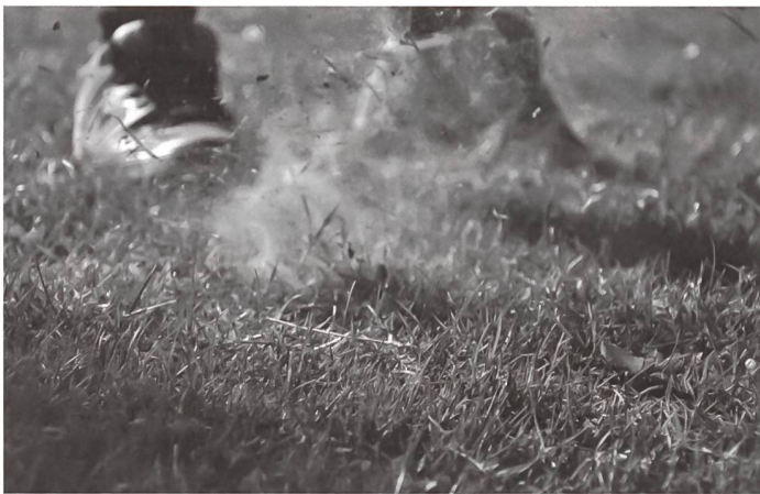
Das Siegerbild von Joël Wirz.

Internationaler Fotowettbewerb für Kinder und Jugendliche bis 21 Jahre + + + seit 1996 jährlich durchgeführt + + + Über 20 000 Teilnehmende weltweit Concours de photos international pour enfants et jeunes adultes jusqu'à 21 ans + + + depuis 1996 chaque année + + + plus de 20 000 participants et participantes dans le monde entier