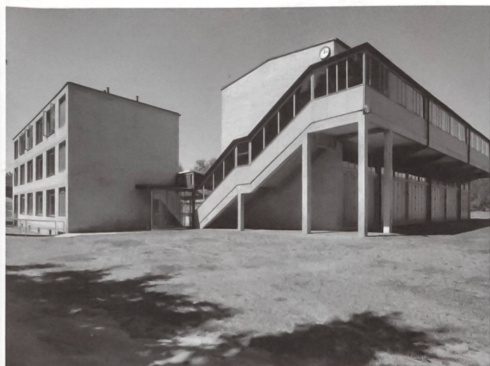
Hannes Meyer. Bundesschule des Allgemeinen Deutschen Gewerkschaftsbundes, 1928-1930, Bernau bei Berlin (Restauro e riuso, 2001-2008).

Il restauro e riuso del patrimonio costruito del XX secolo rappresenta oggi una scommessa fondamentale dal punto di vista storico, culturale, economico e della sostenibilità ambientale. Nei prossimi decenni gli interventi sul patrimonio recente sono destinati ad aumentare per diverse ragioni: per i fenomeni di degrado materiale (gli edifici arrivano via «a fine corsa»), per l'evoluzione degli standards tipologici, per l'adeguamento normativo, ecc.