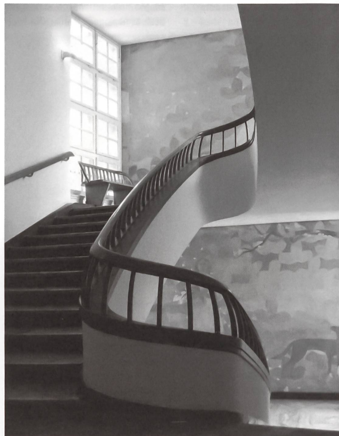
Max Ernst Haefeli, Werner Max Moser, Rudolf Steiger. Kantonsspital Zürich (oggi Universitätsspital), Rämistrakt, 1941–51, Zurich (Restauro, 2005–2006).

La struttura, organizzata in testi teorici e casi studio, è il risultato di diverse considerazioni. In primo luogo deriva dal fatto che nell'intervento sul costruito recente non esistano «ricette pronte all'uso», ma piuttosto esempi di interventi realizzati, i più riusciti dei