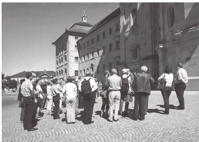
Schwerpunkt Sakralbauten: Besucher vor der Klosterkirche Einsiedeln.