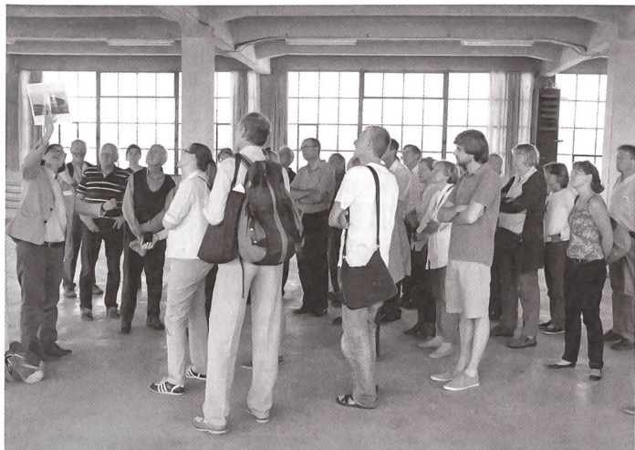
Visiteurs dans les anciennes usines Bata à Möhlin (AG).

50 000 personnes ont visité, les 8 et 9 septembre, la 19 e édition suisse des Journées européennes du patrimoine. Ces deux matériaux du quotidien à l'affiche cette année, ont attiré un grand public.