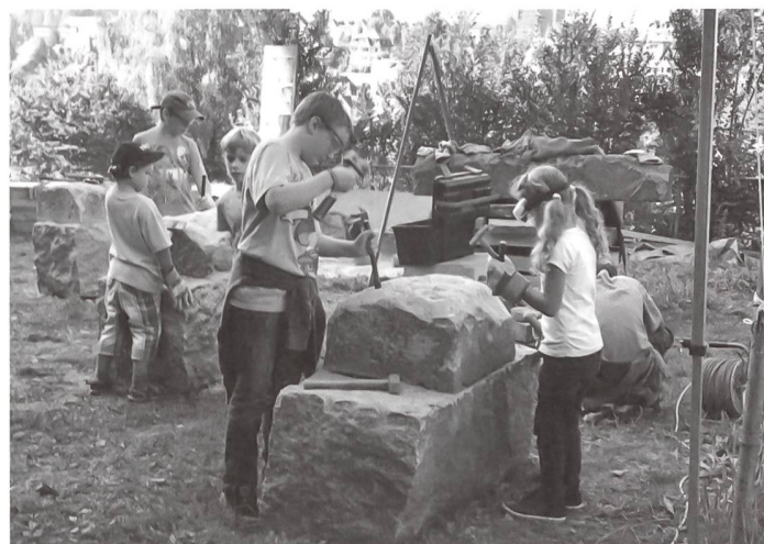
Am Steinhauer-Workshop für die Kleinen in Luzern.

50 000 Personen fanden sich am 8. und 9. September zur 19. Schweizer Ausgabe der Europäischen Tage des Denkmals ein. Die alltäglichen Materialien, welche dieses Jahr im Zentrum standen, entwickelten enorme Zugkraft.