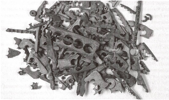
Typische Hinterlassenschaften des Paternosterhandwerks. Die Paternosterer beziehungsweise Rosenkranzhersteller drehten aus Tierknochen Perlen und kleine Ringe für Gebetsschnüre. In mittelalterlichen Abfallschichten am Limmatufer, in unmittelbarer Nähe zur Fraumünsterabtei, finden sich zahlreiche solche Werkstattabfälle.