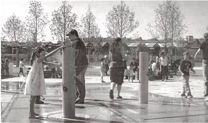
Früher ein Güterbahnhof, jetzt ein neues Stadtquartier: Mensch und Natur sollen im Basler Erlenmattpark in engem Kontakt stehen.