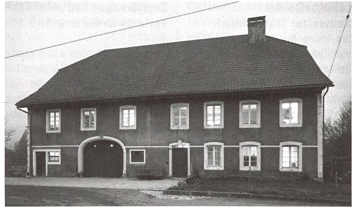
Das prämierte Bauernhaus steht im Kern des Juradorfs Cortébert.