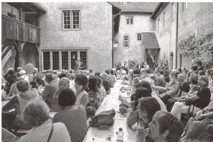
... feiern... ... fêter...

Le thème d'une brûlante actualité, «Feu et lumière» a attiré, les 8 et 9 septembre, quelque 40 000 visiteurs.