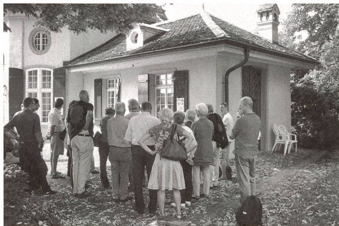
... staunen. ... être étonné.

Le grand succès des journées européennes du patrimoine est stimulation et motivation à s'engager avec