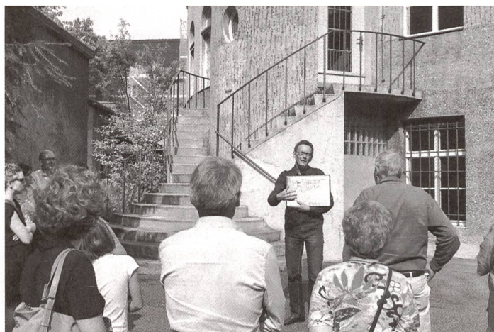
... zuhören... ... écouter...

Das grosse Interesse an den Europäischen Tagen des Denkmals ist Ansporn und Motivation, sich für die Erhaltung unseres reichen kulturellen Erbes mit Begeisterung