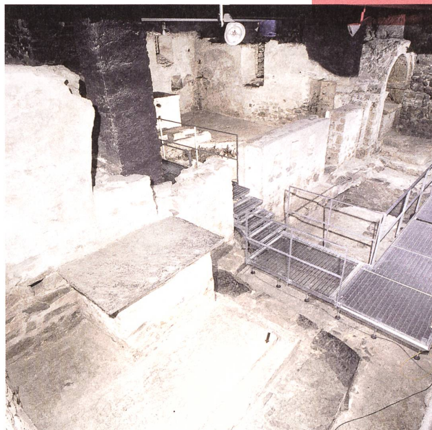
Meiringen, die archäologischen Reste unter der Kirche. Aktueller Zustand nach erneuter Restaurierung 2006.

Naefs Name ist im Bestand der schweizerischen Denkmäler untrennbar mit den Erhaltungsmaßnahmen auf Schloss Chillon und dem ehemaligen Cluniazenserpriorat Romainmôtier verbunden. Eine seiner ersten Rettungen bildete die Ausgrabung unter der Michaelskirche von Meiringen, deren Vorgängerbauten der dortige Lehrer 1915 unter meterhohem Schutt entdeckt hatte und dessen Grabungen zeitweise zumindest finan-