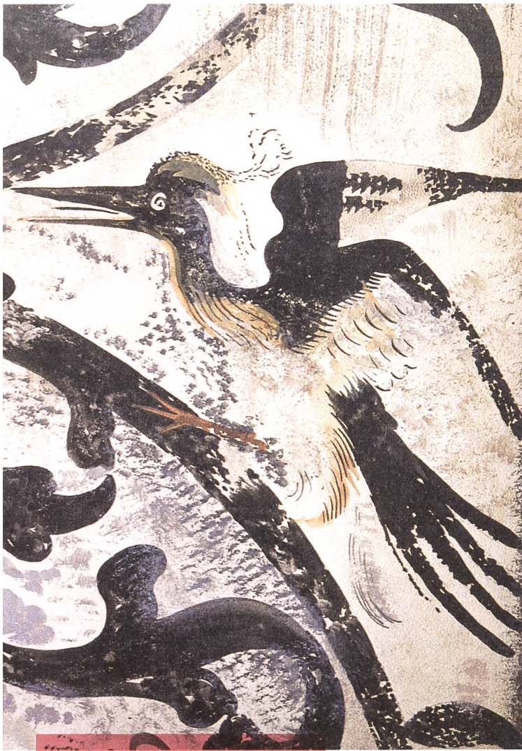
Aquarell (Ausschnitt) von Rudolf Mürger der 1899 zerstörten Wandmalereien im Sommerrefektorium der Berner Dominikaner.

te eine erneute Anpassung des Namens zu «Schweizerische Gesellschaft für Erhaltung historischer Kunstdenkmäler». Das Ringen um den Namen ist symptomatisch für das Ringen um die nationale Ausrichtung. Der Urvater der Schweizerischen Denkmalpflege, der Zürcher Kunsthistoriker und Bauforscher Johann Rudolf Rahn (1841–1912) wirkte als erster Vizepräsident. Präsident war der Genfer Maler Théodore de Saussure (1824–1903). Eine breite Abstützung war Programm. Es ging um die Rettung von Kulturgut nicht bloss vor dessen Abbruch, sondern insbesondere auch vor seinem Verkauf. Als Beispiel sei das Graduale von St. Katharinenthal (TG) genannt, das um 1820 in Besitz eines Konstanzer Antiquars und Ende des 19. Jahrhunderts in England auftauchte, bevor es schliesslich 1958 für 368 000 Franken zurück gekauft werden konnte; ein illustres Beispiel dafür, wie viel teurer Repatriierung als Konservierung sein kann. Um ähnlichem Tun entgegenzu-