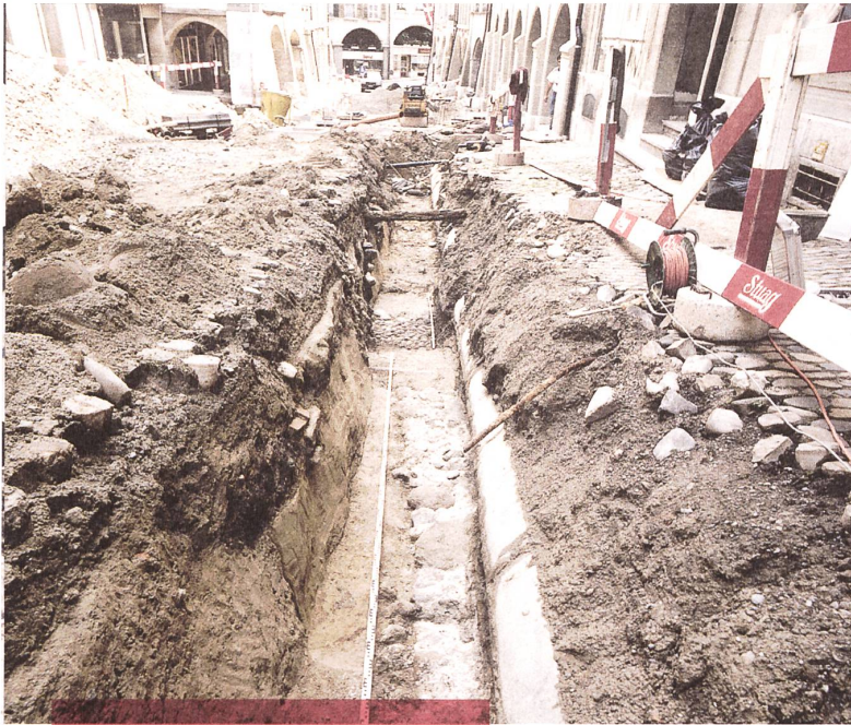
Die Grabungen 2003 am Kirchbühl in Burgdorf lieferten grundlegende Erkenntnisse zur zähringischen Gründungsstadt. Ihre Subventionswürdigkeit war damals grundsätzlich umstritten.

ziell aus dem Ruder liefen. Nachdem eine Delegation der Kirchenbehörde persönlich bei Bundesrat Calonder vorgesprochen hatte, dieser 1916 – trotz Kriegseinschränkungen – eine Inspektion vor Ort durch den Gesamtbundesrat anordnete, nahm die Sache unter Naef geordnete Form an und konnte als eine der bedeutendsten archäologischen Stätten der Nachwelt zugänglich erhalten und erschlossen werden. Ob seit diesem Datum der Gesamtbundesrat je wieder auf einer laufenden archäologischen Grabung war?