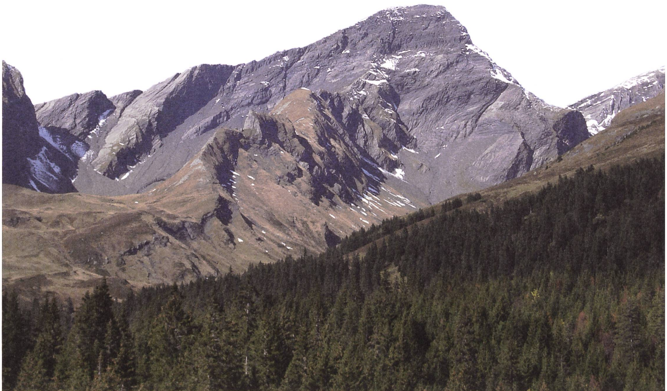
Das Schwarzhorn oberhalb Grindelwald-First.

kann auch hier wieder die Färbung von Gebäuden (dunkle Bemalung, Bedachung oder durch die Sonne geschwärztes Holz) das Namenmotiv sein (so vielleicht in Schwarzhäusern ).