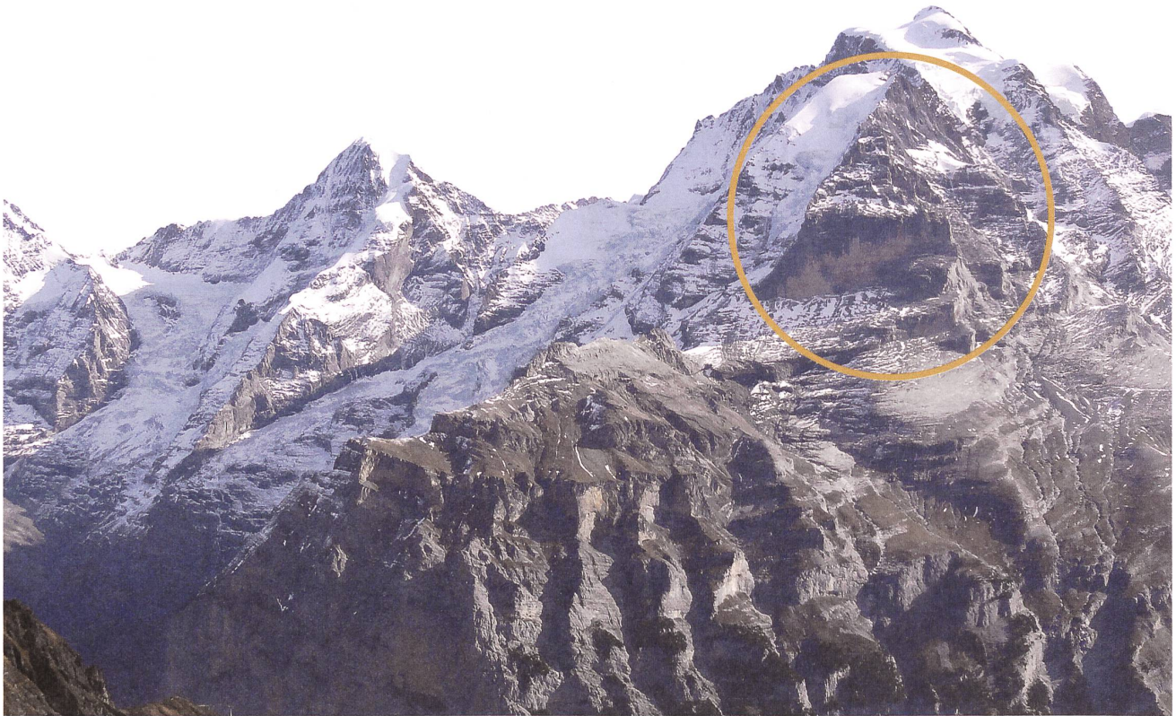
Das Rotbrätt am Fuss der Jungfrau. Im Vordergrund der Schwarzmönch .

können die Namen zum Teil nicht vom Wort Brunne «Quelle, Brunnen» unterschieden werden, das in Zusammensetzungen auch in der verkürzten Form Brunn/Brun vorkommen kann. Schliesslich kann Rot in seltenen Fällen auch von schweizerdeutsch Rod , einer gekürzten Form von Gerod , Grod «Rodung» herrühren.