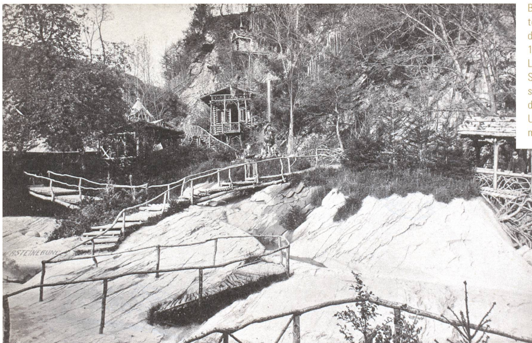
Blick über die bepflanzten Gletschertöpfe in den Gletschergarten um 1875. Rechts die «Galerie Löwenblick», mittig das Schwyzerhüsli und das sogenannte Reliefgebäude, wo sich das «Relief der Urschweiz» befand; oben mittig das Wildkirchli.

Garten durch «elektrische und bengalische Beleuchtung» in Stimmung gebracht. Von Anfang an bot Amrein den Besuchern eine bunte Mischung an Attraktionen. Die Gletschertöpfe, für die an der Kasse «populär wissenschaftlich gehaltene Beschreibungen» – wie das Zeitungsinserat zur Eröffnung versprach – verkauft wurden, dienten lediglich als Ausgangspunkt für einen lehrreichen Vergnügungspark des ausgehenden 19. Jahrhunderts, der in den folgenden Jahren beständig ausgebaut wurde. Am Fuss des Parks wurde bereits ein Jahr nach der Eröffnung ein Wohnhaus im Schweizer Holzstil, nach dem Entwurf des Zürcher Architekten Meierhofer von Weiach (1845–1903) erbaut, das später Museum und Restauration aufnahm. Den gestalterischen Rahmen der Attraktionen bildete – wie im Namen Gletschergarten bereits angelegt – ein kleiner Landschaftsgarten, der mittels geschickter Nutzung von Topografie, Architekturen, Wegführungen und Pflanzungen auf engstem Raum die seinerzeit populären Bilder der Alpenwelt zitierte und so beim Besucher die Fiktion einer alpinen Wanderung hervorrufen sollte. Die freigelegten Gletschertöpfe wurden als ein Stück unwegsame Alpenlandschaft inszeniert, deren gro-