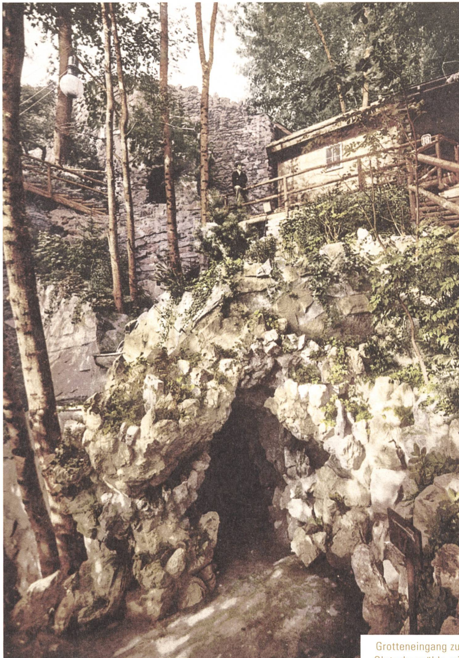
Grotteneingang zur Gletschermühle mit Klubhütte und Ruine um 1907.

sche Gärten ursprünglich nur einen kleinen Zirkel Gelehrter ansprachen, wurden Parkanlagen im Laufe des 19. Jahrhunderts zunehmend zum Vehikel der Volksbildung. Das Arboretum in Zürich beispielsweise, das 1886 angelegt wurde, sollte nach dem Ziel seiner Schöpfer, «nicht nur Schatten und ästhetischen Genuss», sondern «auch Belehrung bieten», wie ein zeitgenössischer Führer durch die Quaianlagen in Zürich betonte. Die wissenschaftliche Ernsthaftigkeit des Arboretums war jedoch von der vergnüglichen Wissenschaft des Gletschergartens weit entfernt. Als «echtes» Naturdenkmal, verbunden mit der spektakulären Darstellung der Theorie seiner Entstehung in einem Park, war der Gletschergarten nicht nur originell, sondern wohl auch einzigartig unter den Landschaftsgärten seiner Epoche.