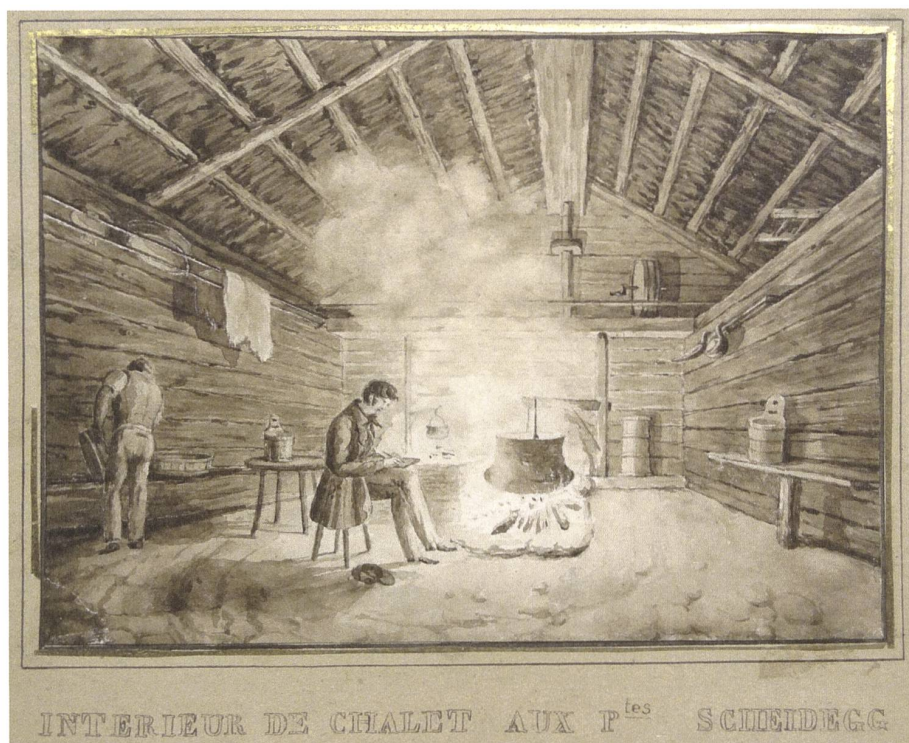
Abb. 4: Anonym: Schreibender Tourist im «Intérieur de chalet aux p tes Scheidegg», Sepia- Aquarell um 1820.

spinnen (Wilderswil BE) auf dem Bördeli zwischen Thuner- und Brienersee.