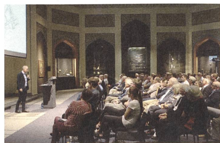
Prélude aux Journées européennes du patrimoine 2016 au Forum d'architecture de Berne.

L'édition suisse des Journées européennes du patrimoine était intitulée «Austausch – Einfluss / Echanges – Influences / Scambio – Influenza / Barat – Influenza». Les nombreuses manifestations qui ont été proposées sur 310 sites, ont accueilli quelque 59 000 visiteurs, ce qui représente une hausse de 13 % par rapport à l'année précédente. Ce succès montre combien notre population éprouve le besoin de se familiariser avec sa propre histoire par l'entremise des monuments historiques. Sur de nombreux sites, on a pu constater que les personnes présentes ne provenaient pas seulement des environs immédiats, mais qu'elles avaient parfois fait des trajets relativement importants pour profiter de l'offre.