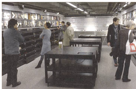
Un regard sur des matériaux propres et autres. Membres du comité directeur du Centre NIKE dans la collection des matériaux de la Zürcher Hochschule der Künste ZHDK.

Aujourd'hui, ce sont les souffrances des habitants des pays dévastés par la guerre et la situation des personnes qui fuient cette région qui sont au centre de nos préoccupations et appellent l'intervention urgente de nos sociétés; et il est juste qu'il en soit ainsi. Cependant, nous ne devons pas oublier la destruction du patrimoine culturel, ce crime de guerre qui, pour de longues générations, sape les fondements mêmes d'une société, que ce soit par le dynamitage de monuments ou par la vente de biens culturels à l'étranger. L'effacement de l'histoire met fin au dialogue avec le patrimoine culturel, ce dialogue qui fait de nous des personnes modernes, éclairées et autonomes, parce qu'ancrées dans l'histoire. Le but de l'«Etat islamique» apparaît ainsi clairement, et son combat contre la diversité culturelle ne conduit pas au paradis, mais à l'âge de la pierre.