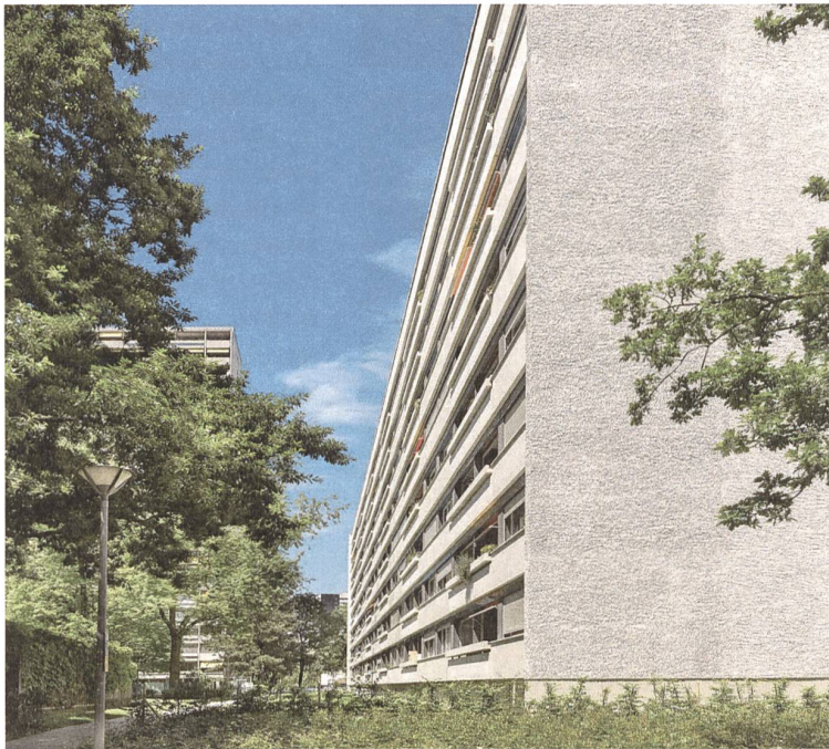
Abb. 6: Die angebaute, neue Raumschicht im Tscharnergut in Bern, Rolf Mühlethaler und GWJ.

Auch die Hochhaussiedlung Tscharnergut in Bern-Bethlehem, 1955–1961 erbaut und als schützenswert eingestuft, wird gegenwärtig erneuert. Ihre 800 gleichartigen Dreizimmerwohnungen werden durch den Anbau einer ganzen Raumschicht um 20 Prozent grösser; durch Zimmerochaden liessen sich ausserdem Zwei- und Vierzimmerwohnungen schaffen, sodass ein differenziertes Wohnungsangebot auch für Familien entsteht. Die erste von acht identischen Hochhausscheiben ist inzwischen von den Architekten Rolf Mühlethaler und GWJ umgebaut worden – die Veränderung ist äusserlich kaum sichtbar, und die Miete einer Vierzimmerwohnung liegt nach der Erneuerung bei nur rund 1700 Franken. Das ist nur möglich, weil beim Umbau zahlreiche Kompromisse gefunden wurden: «Eine vollständige Anpassung an heutige Baustandards» sagt Architekt Rolf Mühlethaler, «hätte das Tscharni zerstört.»* (Abb. 6)