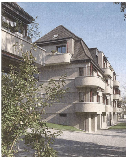
Abb. 7: Die Genossenschafts- siedlung Vrenelisgärtli in Zürich Unterstrass, Fahrländer Scherrer Architekten.

Wohnsiedlungen werden kaum je abgebrochen, weil sie etwa baufällig wären. Der Grund sind vielmehr veränderte gesellschaftliche und individuelle Bedürfnisse: das Bevölkerungswachstum in den Städten, sowie die persönlichen Ansprüche der Wohnungssuchenden, vor allem der Familien. Ersatzneubau ist daher heute ein unverzichtbarer Teil jeder umfassenden Erneuerungsstrategie. An jedes einzelne Projekt sind aber kritische Fragen zu stellen: Für welche Zielgruppen und welchen Bewohnermix wird gebaut? Ist sichergestellt, dass auch Menschen mit geringerem Einkommen profitieren? Sind neben klassischen Famili-