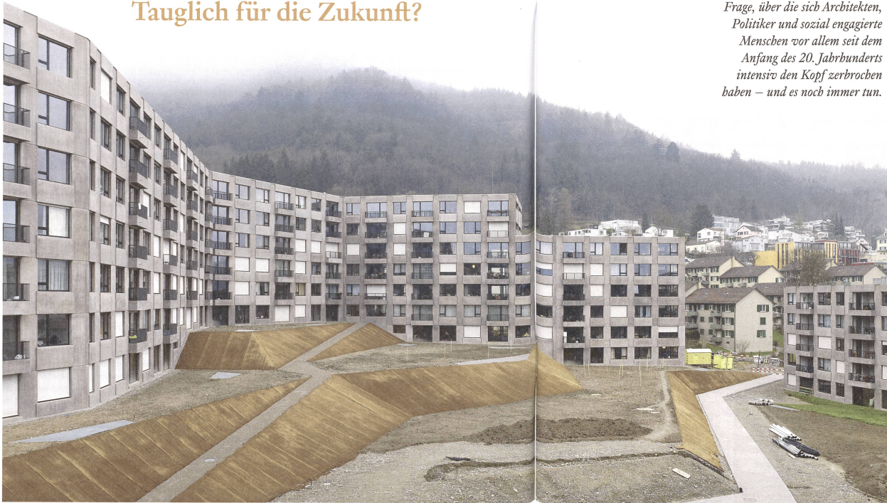
Abb. 1: Der Ersatzneubau in der Zürcher Siedlung Triemli, von Ballmoos Krucker Architekten.