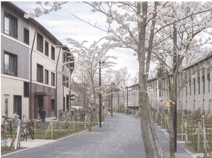
Abb. 4: Der Ersatzneubau Grünmatt in Zürich, Graber Pulver Architekten.

sich in der Folge viele Genossenschaften für die Strategie des Ersatzneubaus. Die Bewohnerinnen und Bewohner selbst stimmen in den Genossenschaften über solche Projekte ab – und in den allermeisten Fällen werden sie fast oppositionslos genehmigt. Gegenwärtig werden jedes Jahr rund 700 bis 1000 Wohnungen abgebrochen und an ihrer statt doppelt so viele neu gebaut. Seit