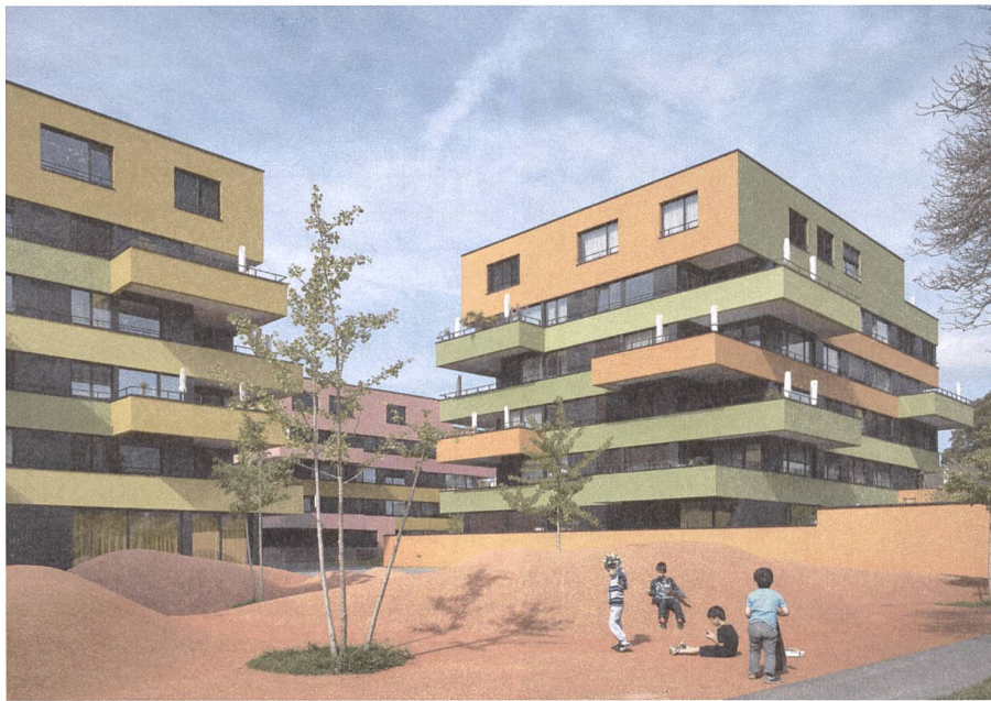
Abb. 5: Die Siedlung Frohheim an der Wehntaler- strasse in Zürich, EM2N und Müller Sigrist Architekten.

meinschaftlichen Hof sind dies die weiten Ausblicke aus den Wohnungen über die Stadt hinweg. (Abb. 1)