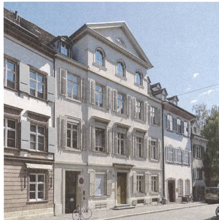
St. Alban-Vorstadt 19, Haus zur Fortuna, Achilles Huber 1810.

Eine «Vorstadt» innerhalb der spätmittelalterlichen Stadtbefestigung – schon der Name der Strasse macht einen stutzig; er stammt aus der Zeit, als sie noch vor der im 11. Jahrhundert ummauerten Kernstadt lag und sich entlang der ursprünglich keltisch-römischen Ausfallstrasse vor dem Tor des ersten Mauerrings als Vorstadt bildete. Erst mit der grosszügig bemessenen neuen Mauer aus der Zeit nach dem Erdbeben von 1356 wurden auch die Vorstädte von der Stadtbefestigung um-