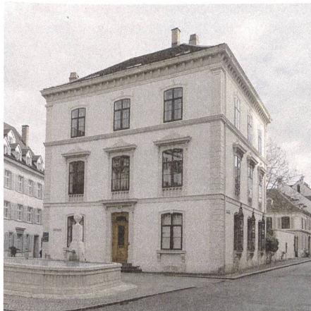
St. Alban-Vorstadt 49-53, Haus zum Schöneck, Melchior Berri, 1840–44.