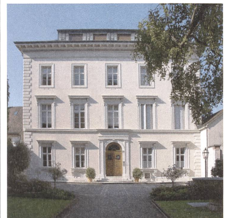
St. Alban-Vorstadt 25, Haus zum Schwarzen Adler oder Rheinhof, Melchior Berri 1839–41.

Davon zeugen um die zwanzig damals entstandenen Neubauten. Die Anwohner dürften sich vor Baustellen kaum mehr zu retten gewusst haben. Allein zwischen 1840 und 1860 wurden gegen vierzehn stattliche Familiensitze errichtet, darunter in Tornähe auch ein mächtiges Fabrikgebäude für den mächtigen Politiker Carl Sarasin-Sauvain. Dieser überraschend fortschrittlich eingestellte Fabrikherr führte im eigenen Betrieb unter anderem eine Kranken- und Alterskasse ein. Da kurz darauf die Stadtmauer niedergelegt wurde, setzte sich der Bauboom nach 1860 mehr in den neu erschlossenen Gebieten weiter ausserhalb fort.