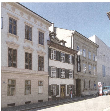
St. Alban-Vorstadt 2–16, im Vordergrund ein Wohnhaus von Christoph Riggenbach 1844, am Ende der Neubautrakt des Kunstmuseums von Christ & Gantenbein 2016.

Mit Aufmerksamkeit durch eine Strasse zu gehen, ist wie der Blick in ein Geschichtsbuch, denn das Strassenbild liefert nichts anderes als einen Abriss der Stadtentwicklung. Hinterfragt man das Gesehene, so finden sich Hinweise auf die Protagonisten dieser Entwicklung: auf die Architekten, die Bauherren, die Politiker und auch auf die sogenannten kleinen Leute wie Handwerker und Arbeiter. Ein Gang durch die St. Alban-Vorstadt in Basel illustriert dies beispielhaft. Allein schon ein Blick über ihren Fassadenverlauf bis zur Einmündung in den St. Alban-Graben demonstriert die historische Spannweite vom Mittelalter bis zur Jetztzeit.